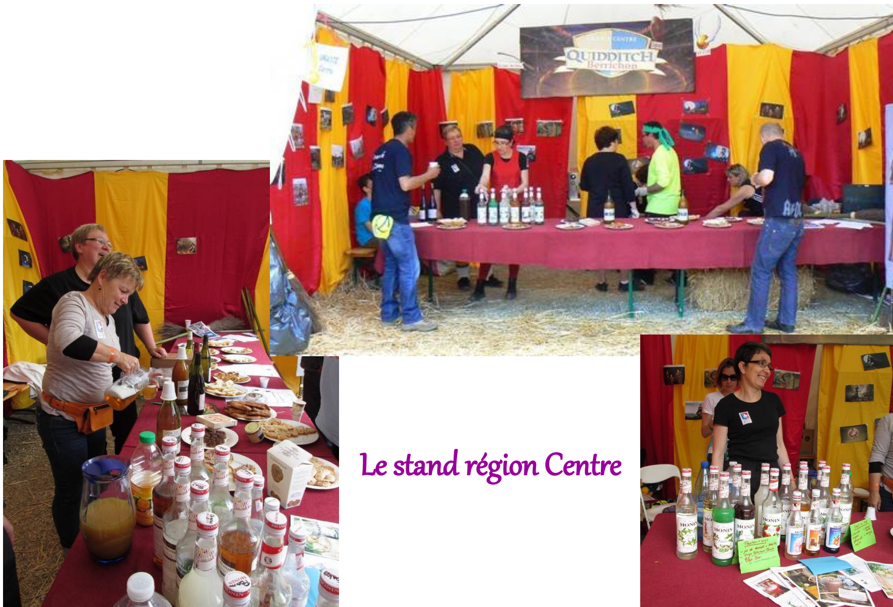
Le stand région Centre