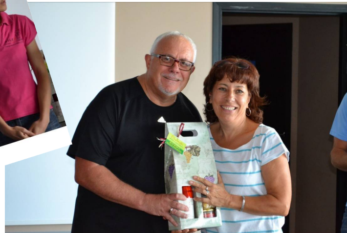
Meilleure dernière équipe