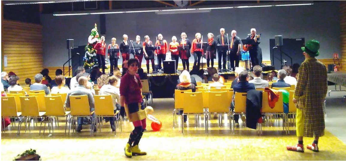
Les Voix Publiques