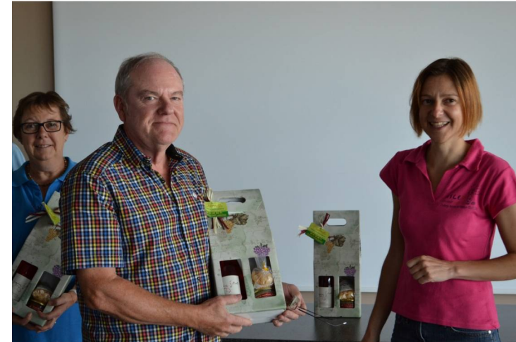
Meilleure ligne masculine