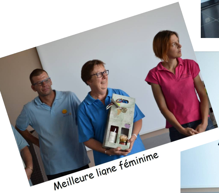
Meilleure liane féminine