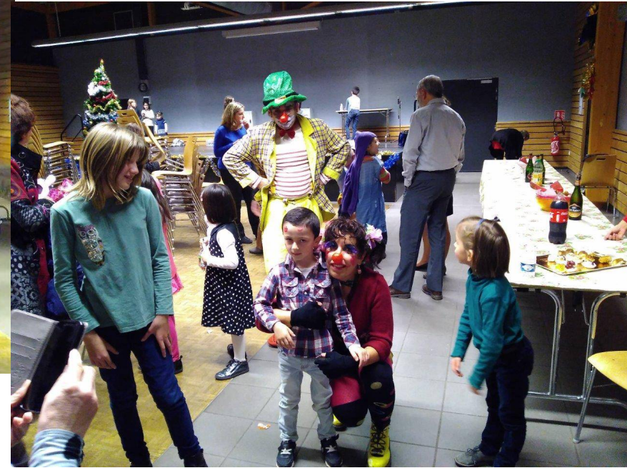
Praline et Caramel