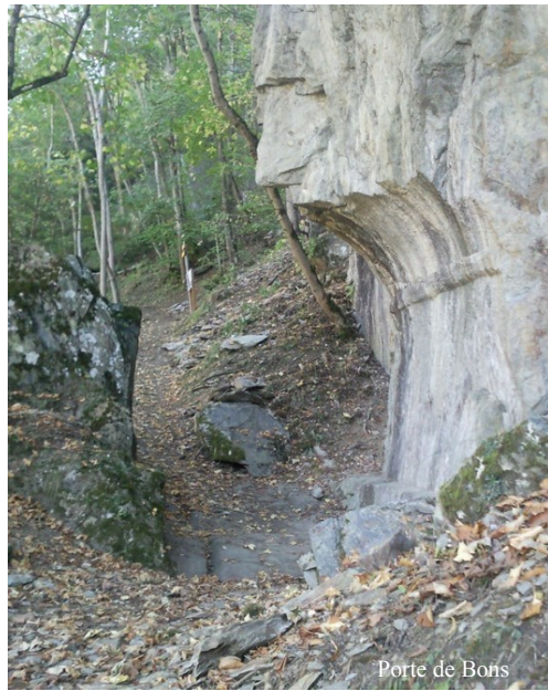
Porte de Bons