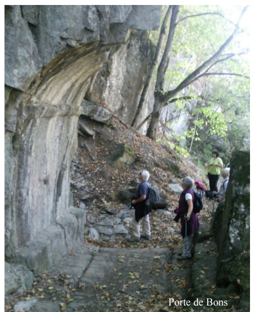
Porte de Bons