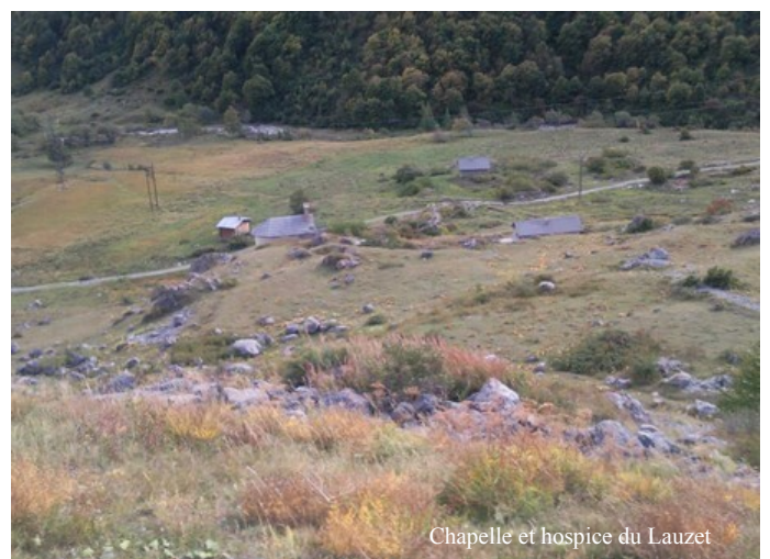
Chapelle et hospice du Lauzet