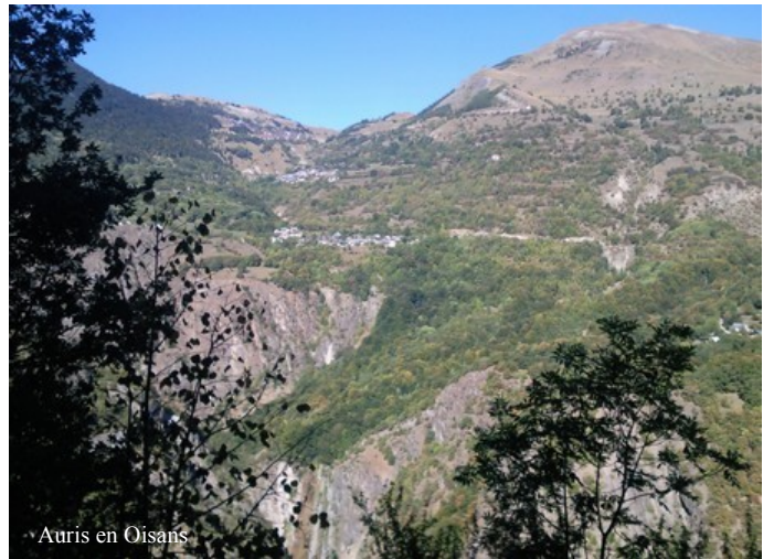
Auris en Oisans