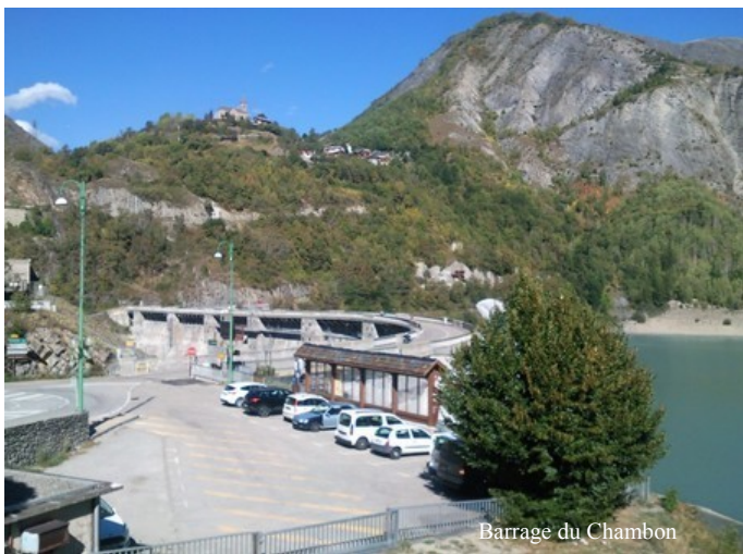
Barrage du Chambon