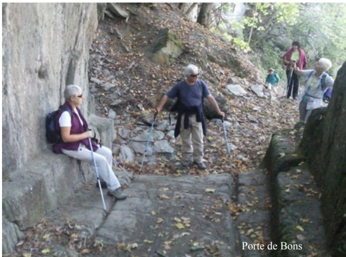
Porte de Bons