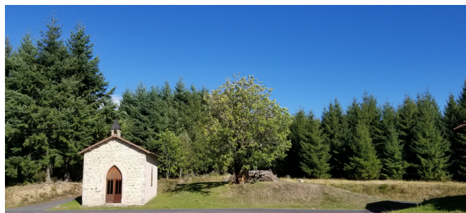
Chapelle du XVème siècle