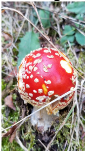
Amanite tue mouche

Automne oblige, les champignons étaient de sortie.