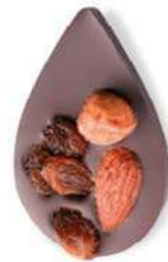
JULIETTE IN THE CITY Chocolat noir 70% de cacao, amande, noisette, raisins secs