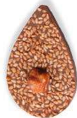
GRAINE DE JULIETTE Chocolat au lait 35% de cacao, sésame, noisette caramélisée