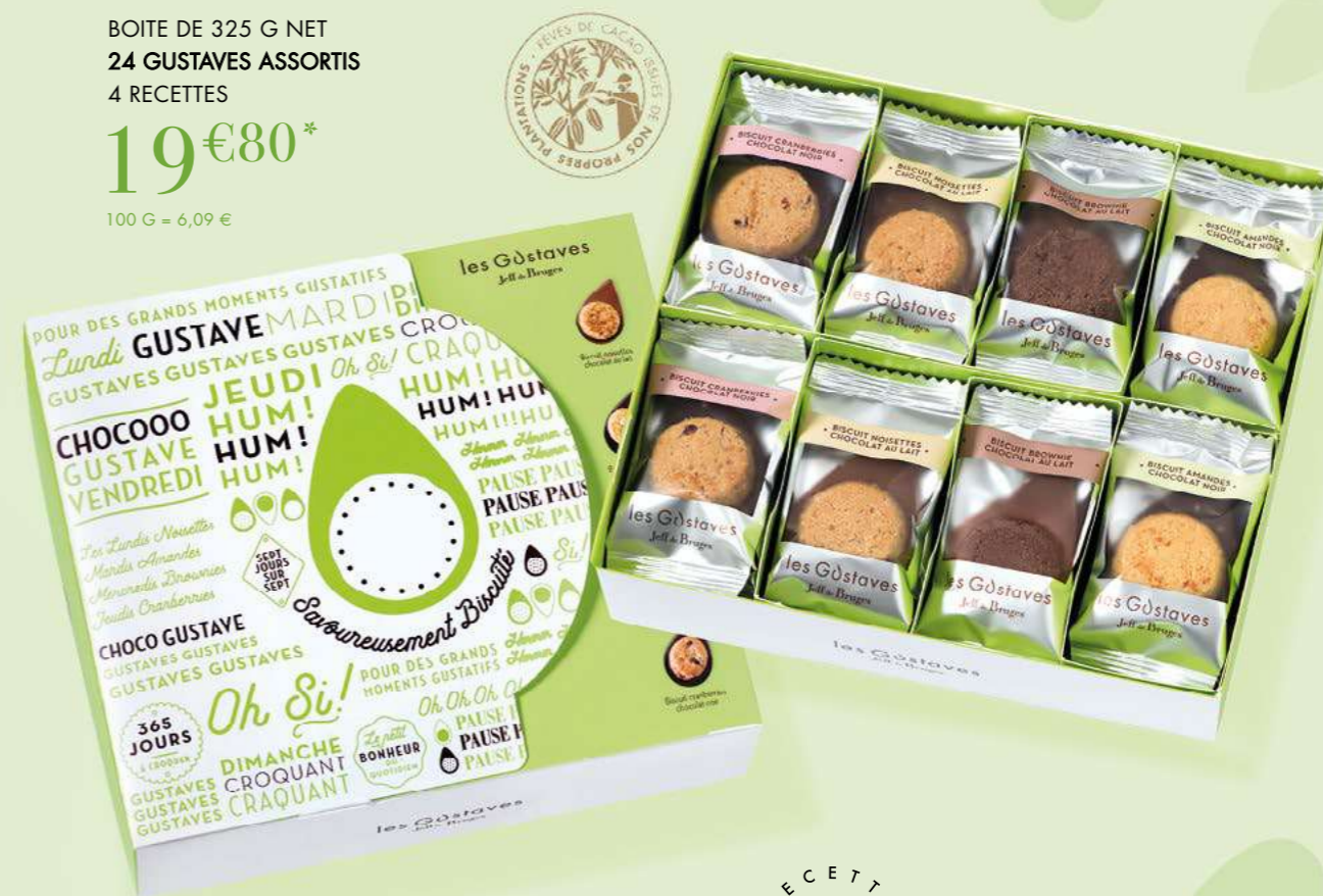
BISCUIT NOISETTES Chocolat au lait 35% de cacao