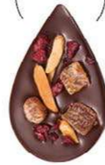
JULIETTE & TOM Chocolat noir 60% de cacao, dés d'abricots secs, amandes caramélisées et morceaux de cerise