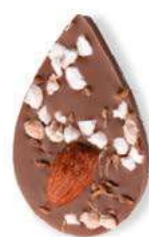
LE SONGE DE JULIETTE Chocolat au lait 35% de cacao, amande, éclats de nougat, brins d'anis