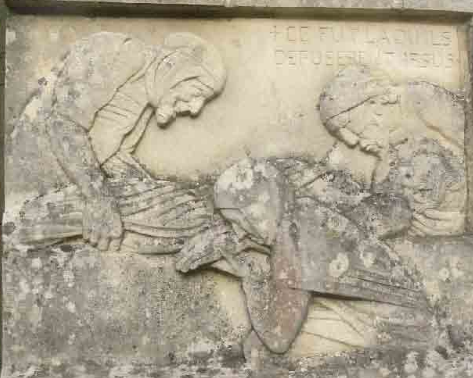
Les premiers vestiges sont religieux