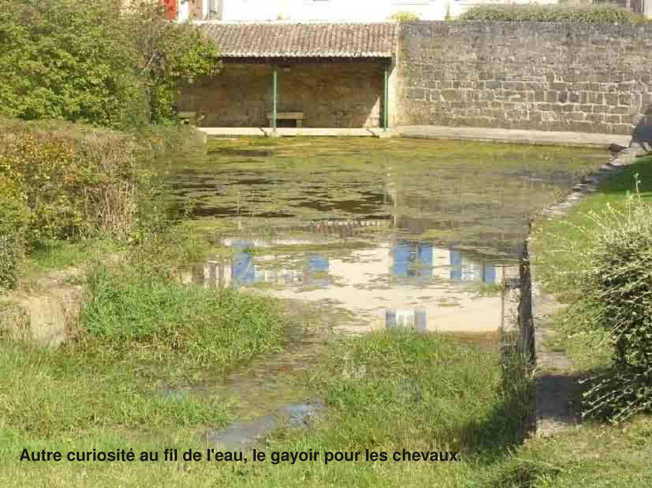
Autre curiosité au fil de l'eau, le gayoir pour les chevaux.