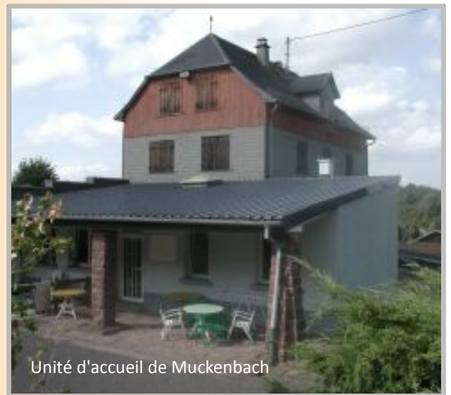
Unité d'accueil de Muckenbach

Près de 200 unités d'accueil risquent de disparaître. En 2011, la FNASCE se mobilise pour conserver ce précieux patrimoine utile à tous les agents. L'ASCE 67 s'associe pleinement à cette démarche de préservation du patrimoine de notre ministère.