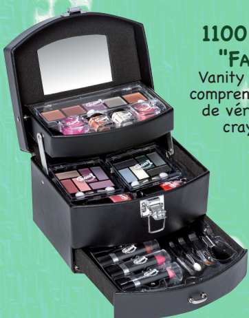
1100 - BEAUTY CASE "FASHION MODEL" Vanity avec compartiments comprenant une large gamme de véritables cosmétiques, crayons et pinceaux.