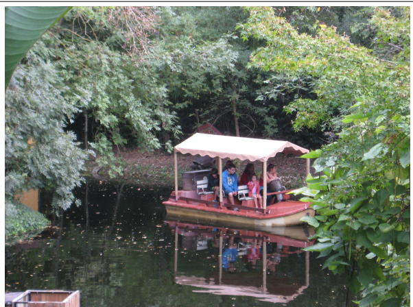
Le Tam-Tam Tour