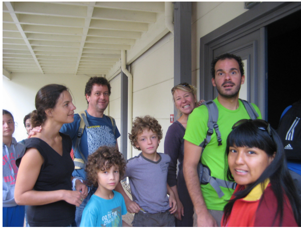
Les Fontaines Musicales