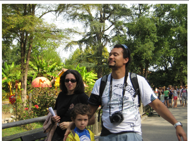
En route pour de nouvelles aventures !