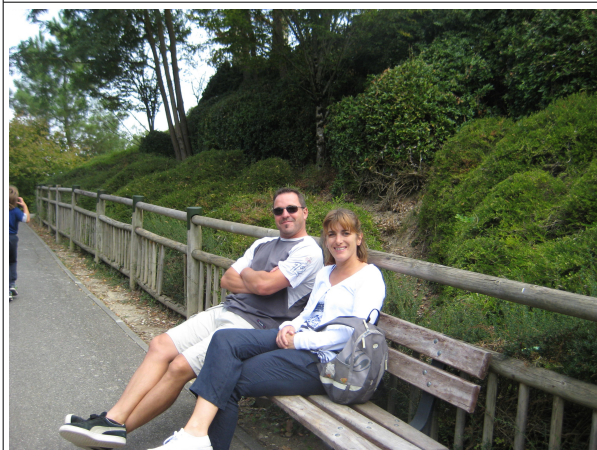
Pause pour les parents