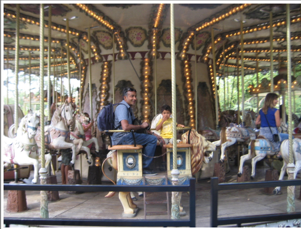
Et tournez manège...