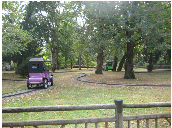
...collectionneurs de vieilles voitures...