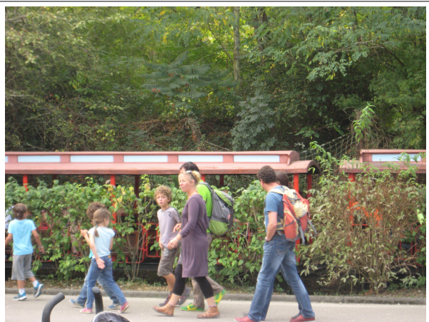
et on court d'une attraction à l'autre