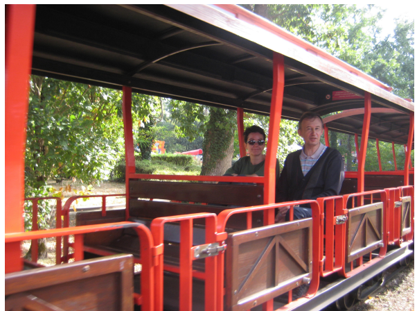
Le Walibi Express