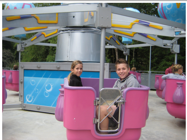
Voyage dans les airs pour les enfants