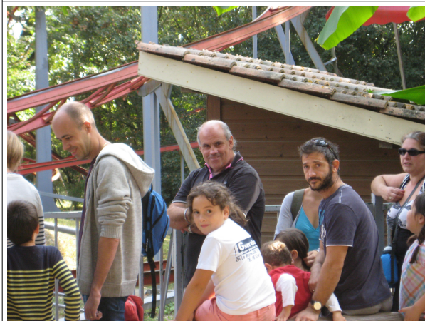
En avant pour la Coccinelle !