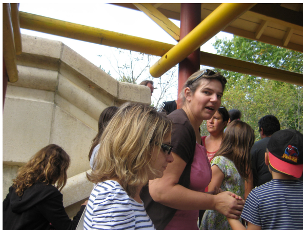
En route pour la Radja River