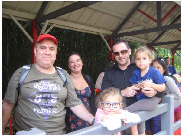
En attendant le Petit train