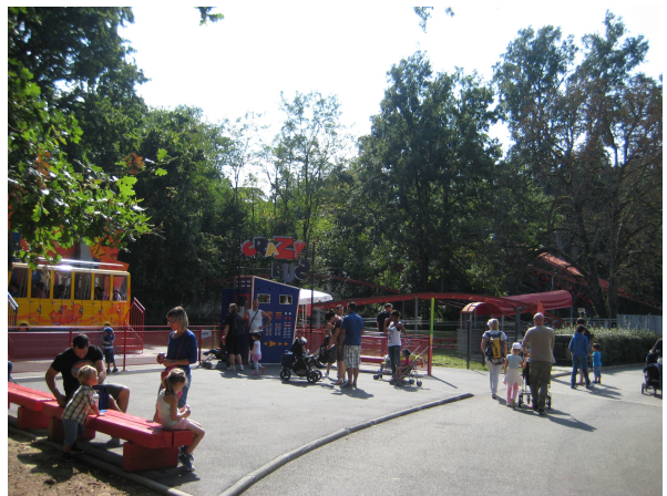
et le Crazy Bus