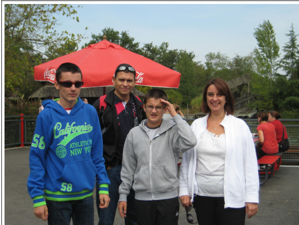
Tous mouillés en descendant...