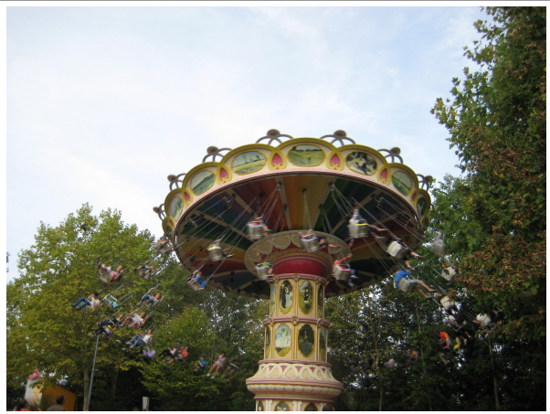
Ça balance !