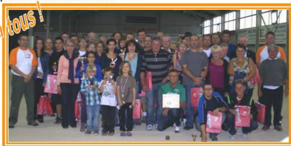
Photo souvenir de tous les participants – merci à tous pour cette belle journée

TOURNOI REGIONAL DU 6 OCTOBRE 2012 - SAINT YRIEIX, CHARENTE (16) COMPTE RENDU REALISE LE 26/10/2012