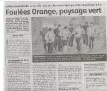
Article « La Montagne » du 07/05/12