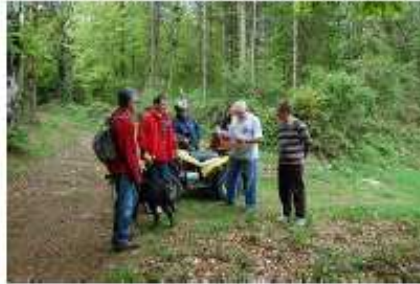
Reconnaissance du parcours