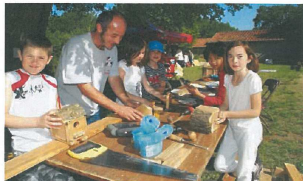
Dimanche, à l'occasion de ses 40 ans, l'Association sportive, culturelle, entraide (ASCE 16) des agents de la DDT et DIRA a organisé une animation ouverte à tous sur le site de «Puymerle», à Aussac-Vadalle.