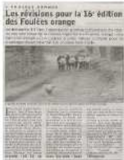
Article « L'Echo du Centre » du 23/04/12

Proclamation des résultats avec remise des récompenses et vin d'honneur Repas convivial pour les bénévoles (couscous creusois) Objectif 2013 = + de 100 coureurs sur le 13,3 km !