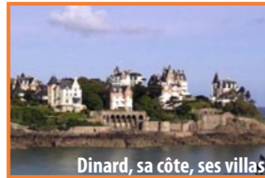
Dinard, sa côte, ses villas