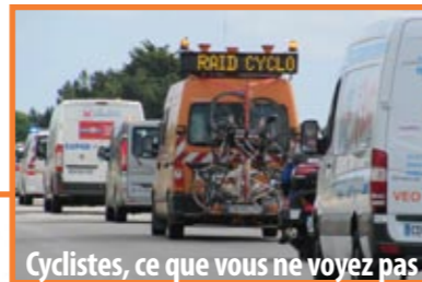
Cyclistes, ce que vous ne voyez pas