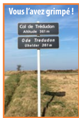
Vous l'avez grimpé !