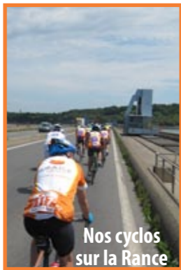
Nos cyclos sur la Rance