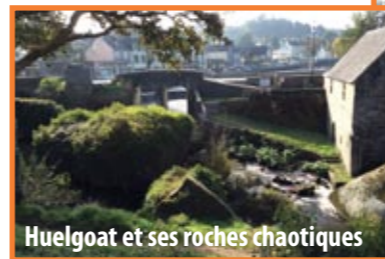
Huelgoat et ses roches chaotiques