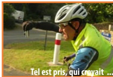
Tel est pris, qui croyait ...