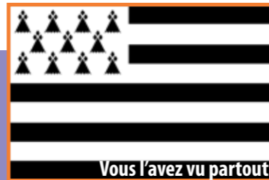
Vous l'avez vu partout