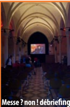
Messe ? non ! débriefing