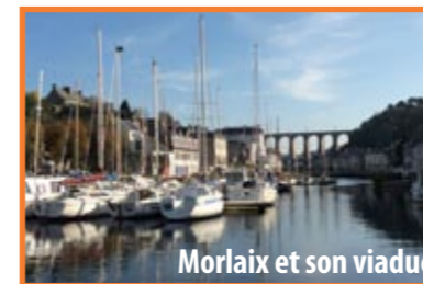
Morlaix et son viaduc