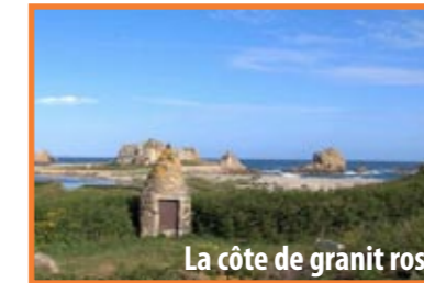
La côte de granit rose