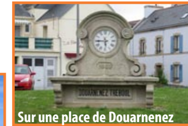
Sur une place de Douarnenez