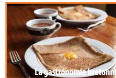
La gastronomie bretonne