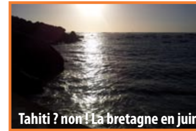
Tahiti ? non ! La Bretagne en juin