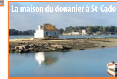
La maison du douanier à St-Cado