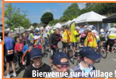
Bienvenue sur le village !