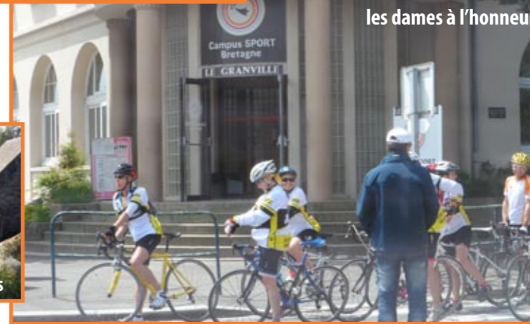
Là où votre aventure a commencé, les dames à l'honneur