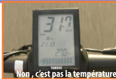
Non , c'est pas la température