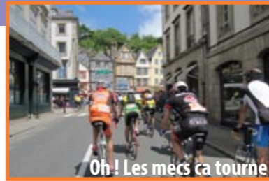
Oh ! Les mecs ca tourne