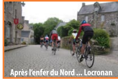
Après l'enfer du Nord ... Locronan