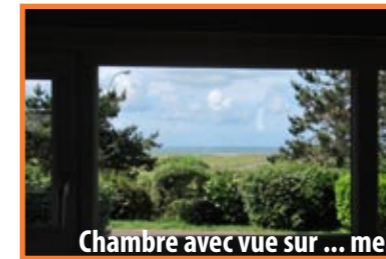
Chambre avec vue sur ... mer