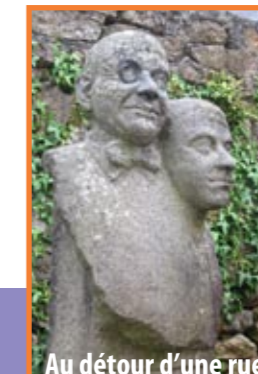
Au détour d'une rue