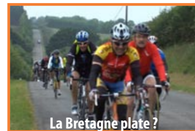
La Bretagne plate ?