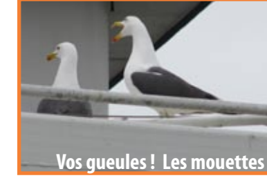
Vos gueules ! Les mouettes