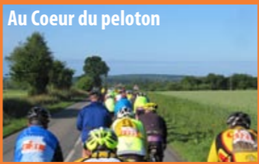
Au Coeur du peloton