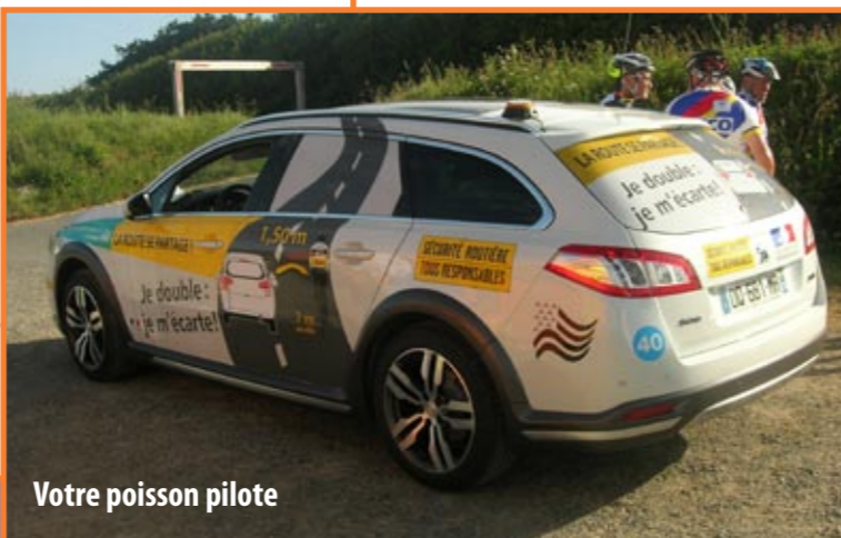
Votre poisson pilote