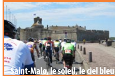
Saint-Malo, le soleil, le ciel bleu