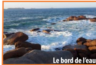
Le bord de l'eau