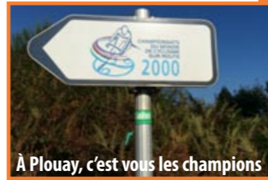
À Plouay, c'est vous les champions