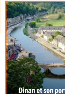
Dinan et son port