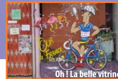
Oh ! La belle vitrine