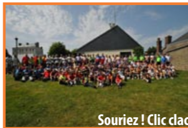
Souriez ! Clic clac