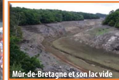
Mûr-de-Bretagne et son lac vide