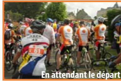
En attendant le départ