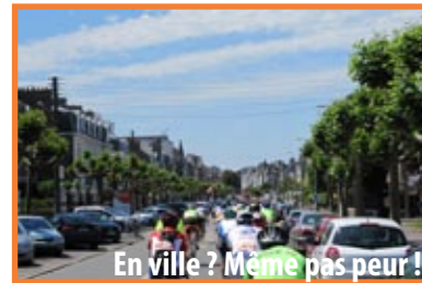
En ville ? Même pas peur !