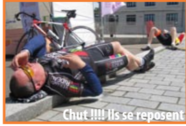
Chut !!!! Ils se reposent