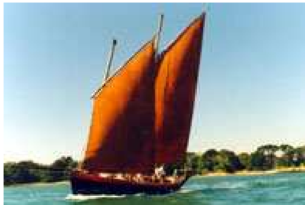
(chambre simple en cale et chambre double sur le pont)