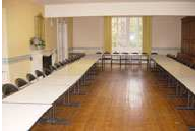
Les salles de réunions (accès wifi en cours)