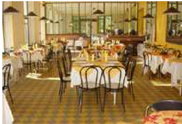
La salle de restauration