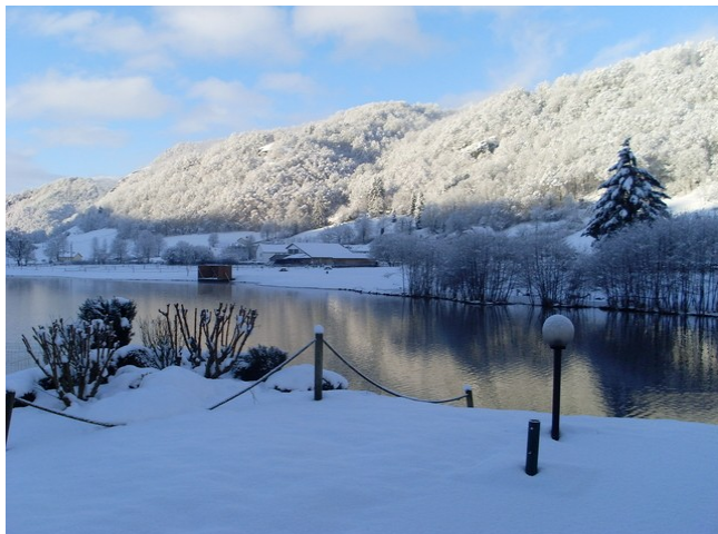
Le site tel que vous le verrez cet hiver, peut être!

Nous avons choisi, pour vous accueillir le merveilleux site du Lac des graves à Lascelle.