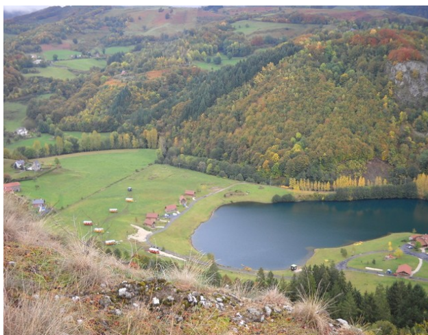
Vue aérienne du site, à droite les bâtiments du séminaire

L'ASCEE 15 sera heureuse de vous y accueillir du 16 au 19 janvier 2012.