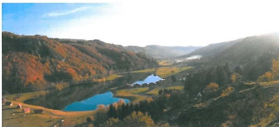
A l'ombre du Puy Mary