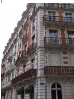
Hôtel des Ambassadeurs