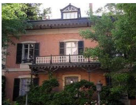
Chalet de l'Empereur