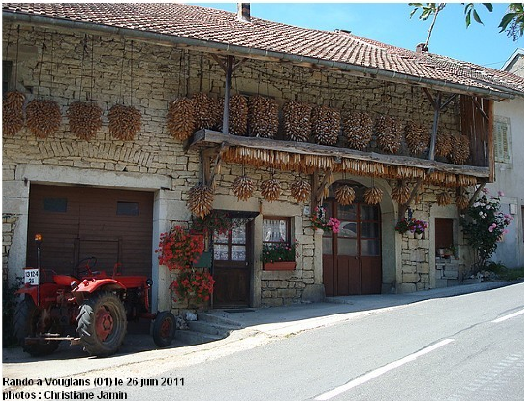
Rando à Vouglans (01) le 26 juin 2011