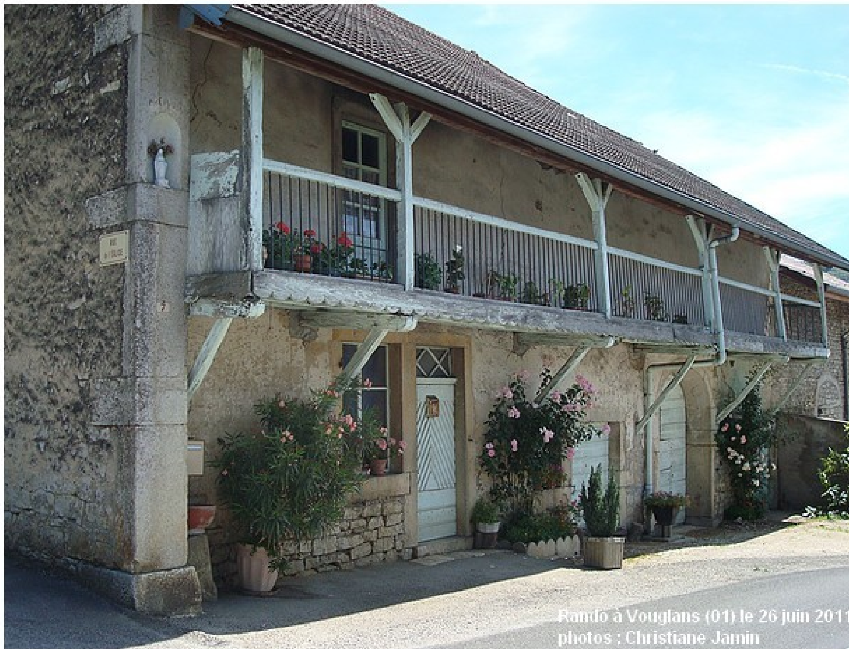
Rando à Vouglans (01) le 26 juin 2011