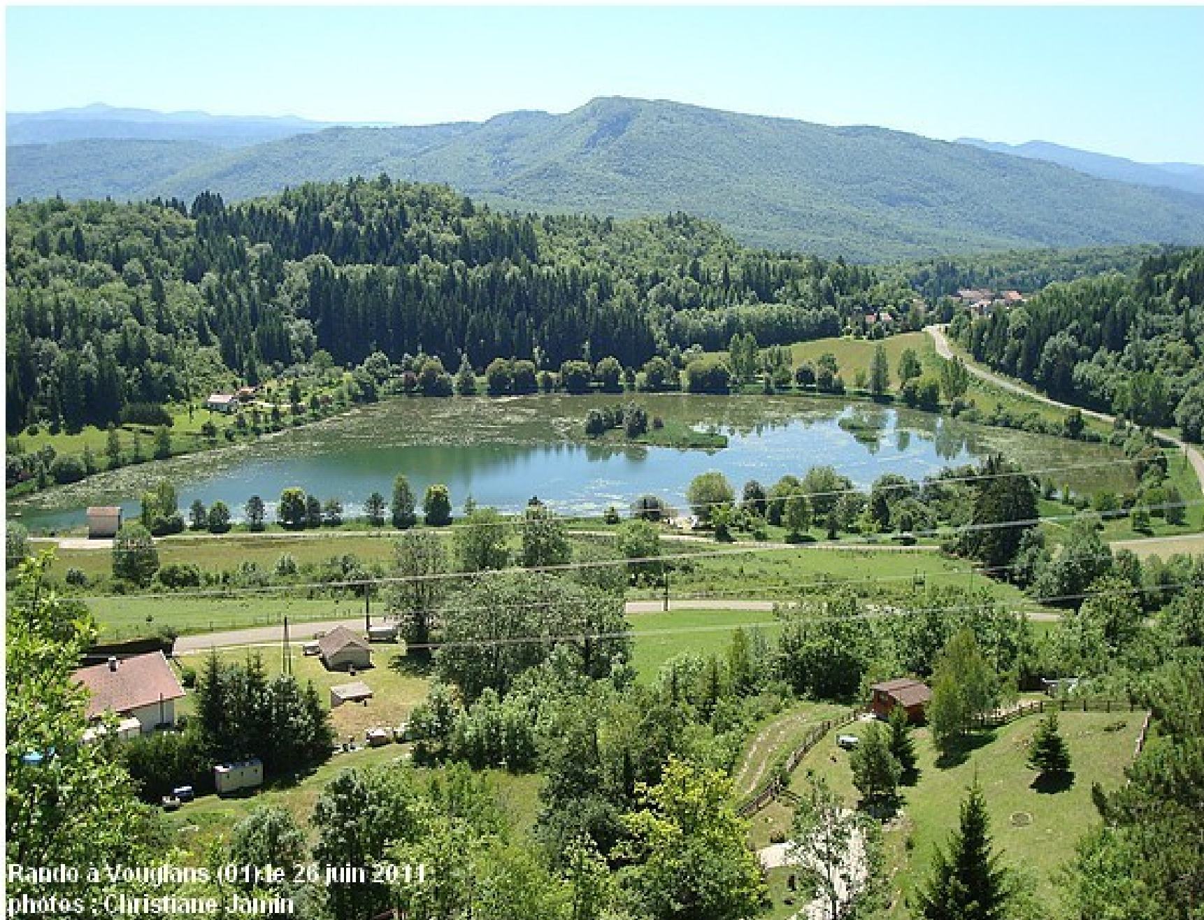
Raudo à Vouglans (01) le 26 juin 2011