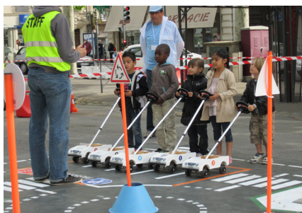
La piste cyclable apprend les bons réflexes au jeune public et l'attention nécessaire à une circulation en sécurité.

la route, il y a de multiples usagers, des voitures, des vélos, des piétons ... C'est un espace à partager, avec des règles à respecter. Il faut aussi penser à notre sécurité dans les transports scolaires : comment assurer une évacuation d'urgence d'un car de manière efficace ?