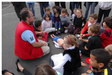
Les pompiers simulant une intervention sur un accident recueillent toute l'attention du jeune public

voiture et un cycliste, par exemple. La distance d'arrêt concerne aussi bien ceux qui conduisent que ceux qui sont piétons et qui s'engagent pour traverser une route. « La distance d'arrêt = la distance de réaction + la distance de freinage ». Cette distance augmente par temps de pluie.