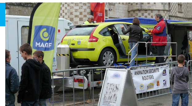
Ce simulateur montre l'intérêt de bien boucler sa ceinture de sécurité, efficace même à faible vitesse en cas de retournement ou de choc.

l'on fasse du vélo, de la moto, du skateboard, du ski ou toute autre activité à risques.