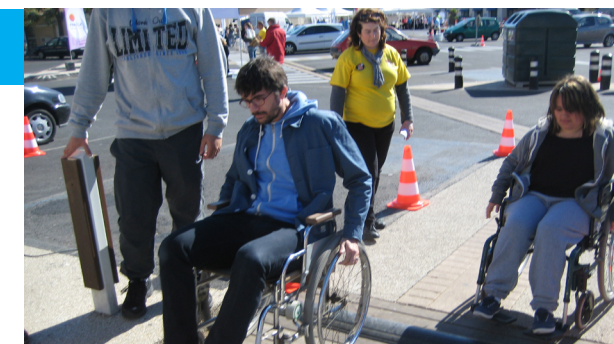
Le parcours en fauteuil permet de se rendre compte de la difficulté à se déplacer en milieu urbain.

propres. Et l'être humain dans tout cela ! Demain nous pouvons être amenés à nous déplacer en fauteuil, avec des béquilles, avec une vision ou une audition amoindrie, l'atelier handicap est l'occasion de se rendre compte de la difficulté de se déplacer dans ces conditions.