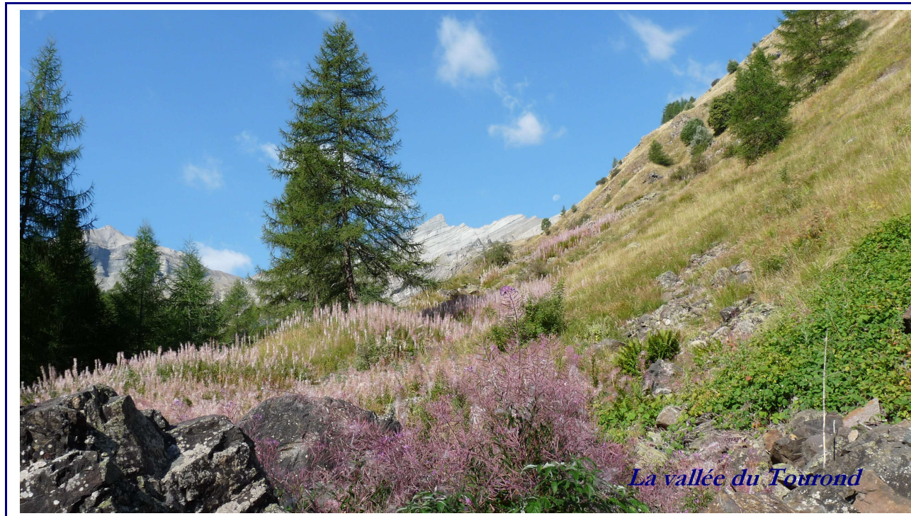
La vallée du Tourond