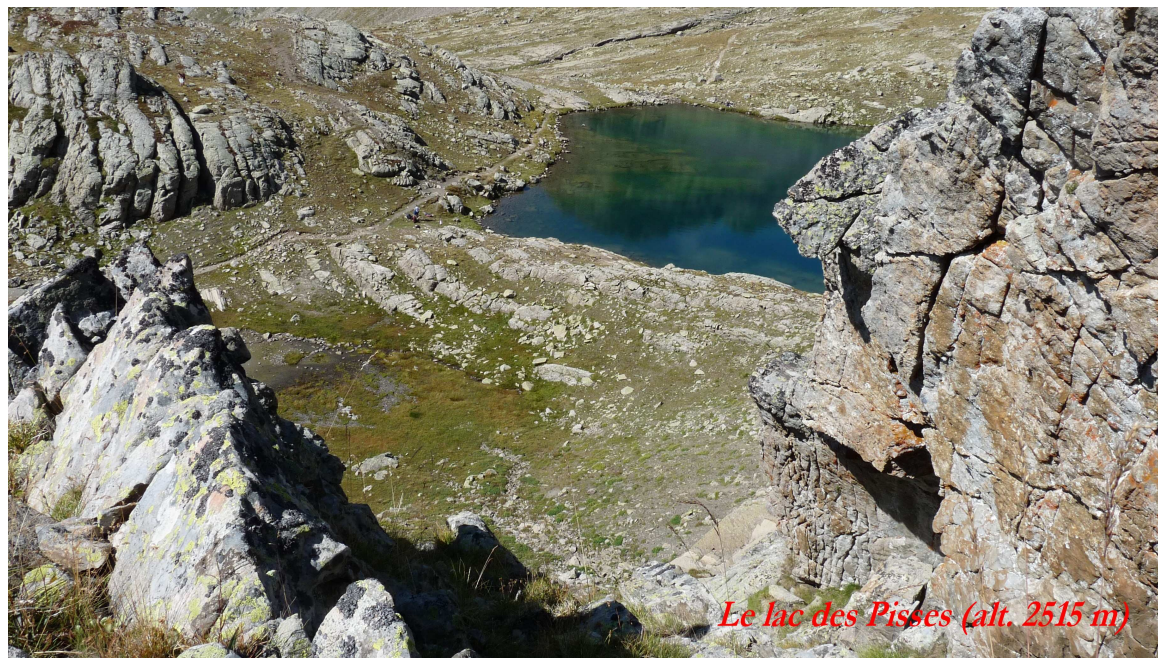
Le lac des Pisses (alt. 2515 m)