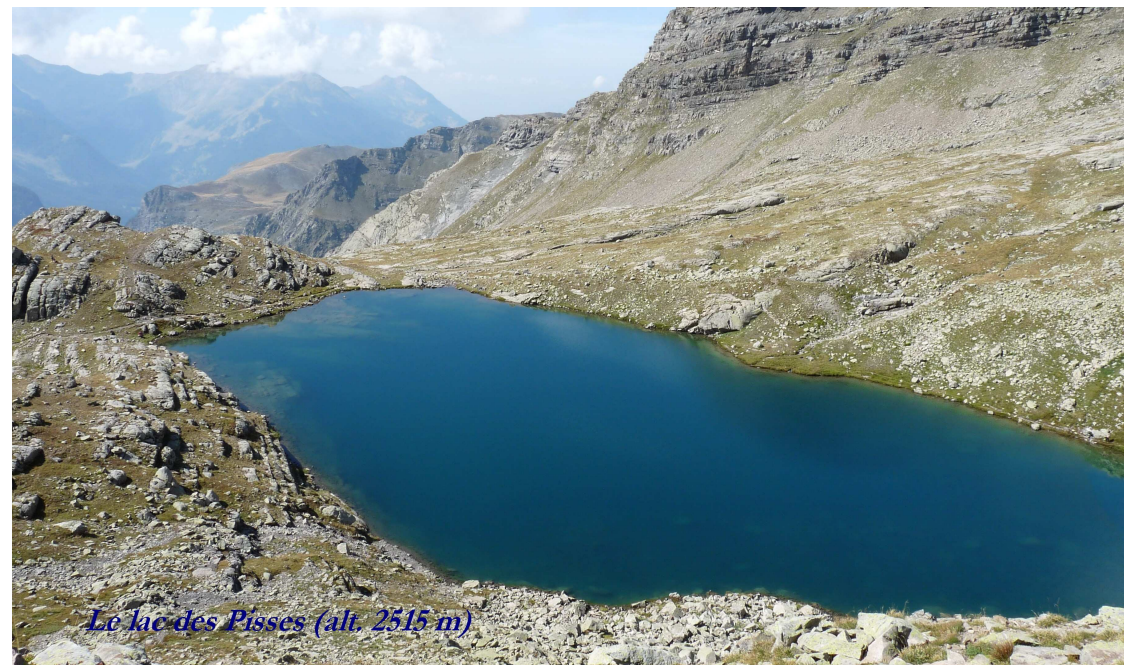
Le lac des Pisses (alt. 2515 m)