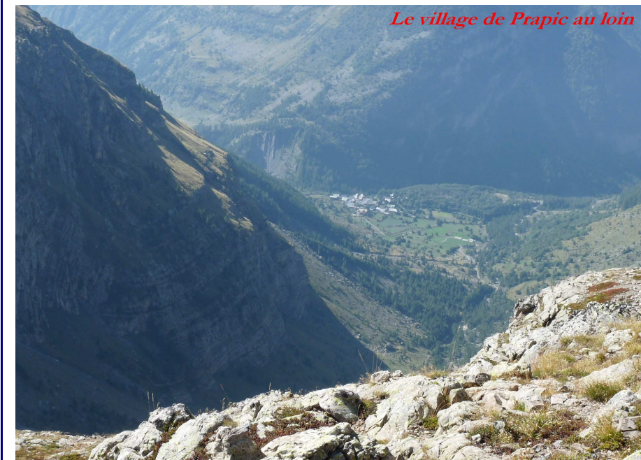
Le village de Prapic au loin