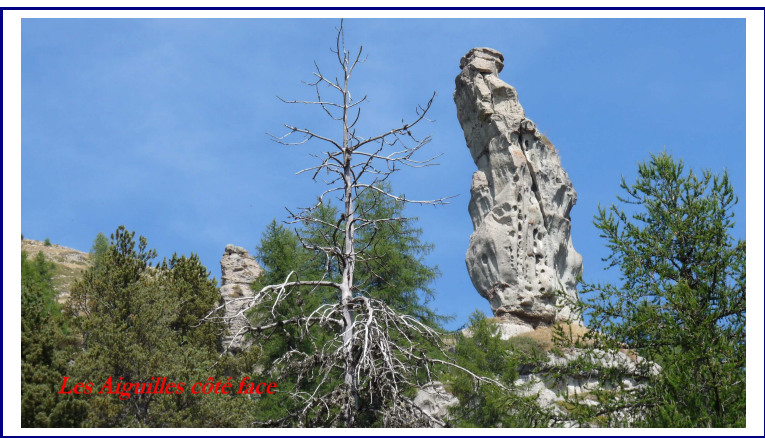
Les Aiguilles côté face