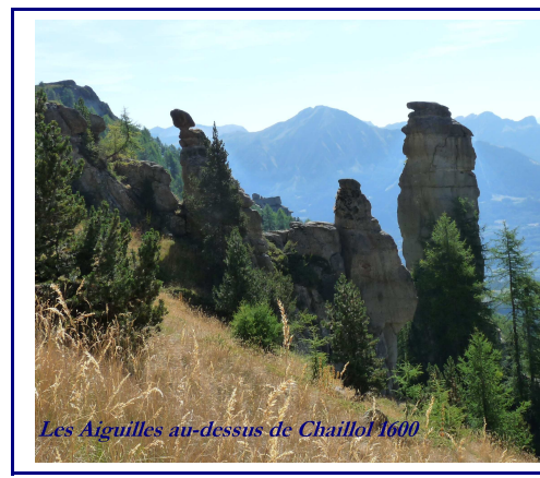
Les Aiguilles au-dessus de Chaillol 1600