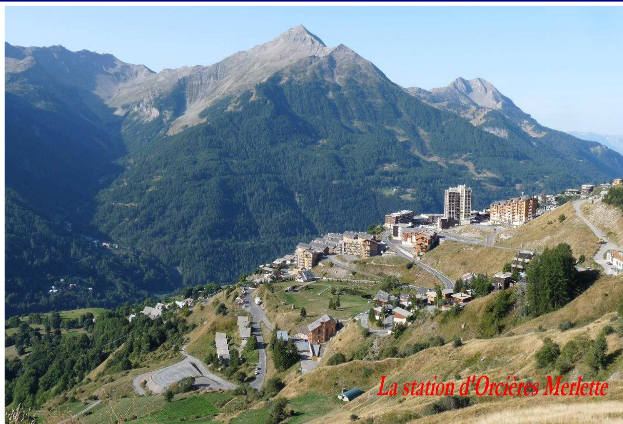
La station d'Orcières Merlette

Le groupe quitte sa plaine pour les vallées plus hautes. Depuis la station d'Orcières Merlette, nous sommes montés aux différents lacs qui scintillaient au soleil (lac des sirènes, lac long et lac profond), jusqu'à parvenir plus haut au Lac principal d'Estaris où nous avons mangé.