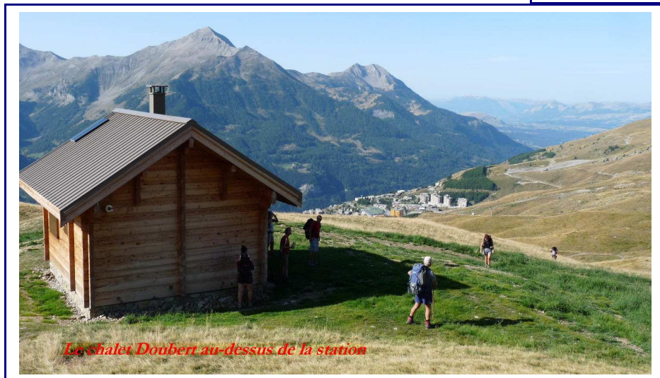
Le shalet Doubert au-dessus de la station