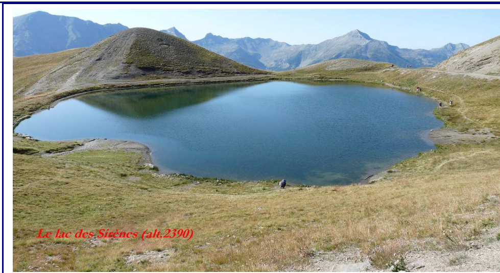
Le lac des Sirènes (alt.2390)