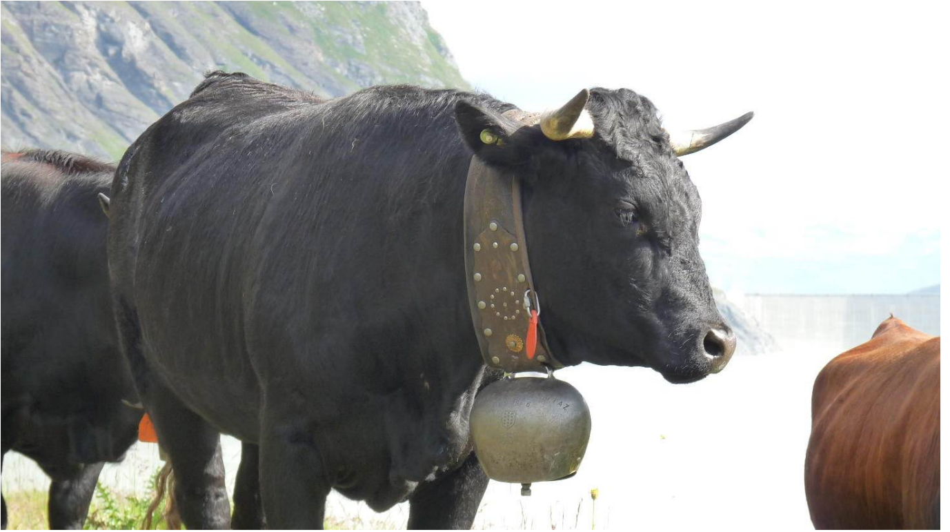
Deux beaux spécimens de bovins d'Anniviers