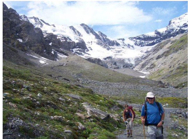
Les glaciers ne sont jamais très loin