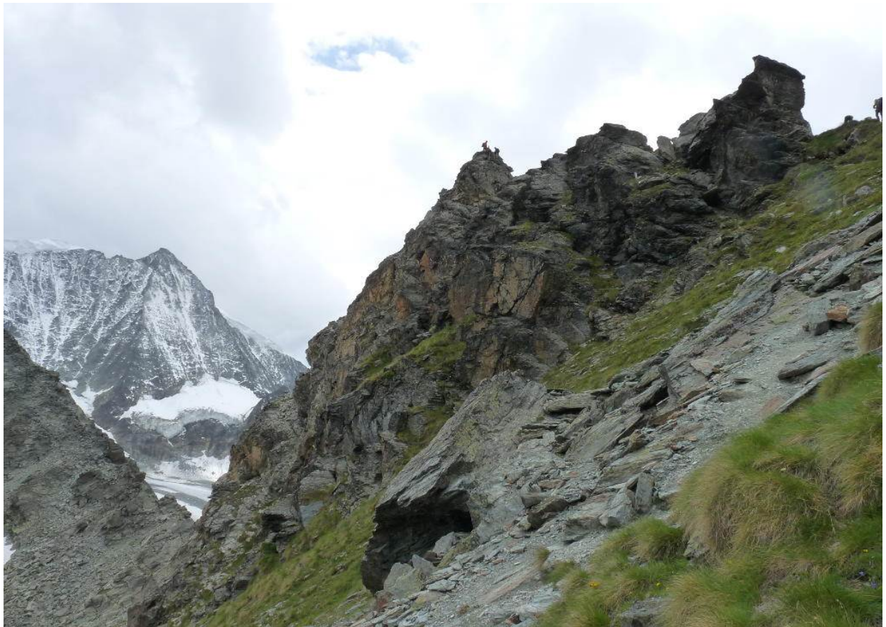
La montée vers le col de Riedmatten