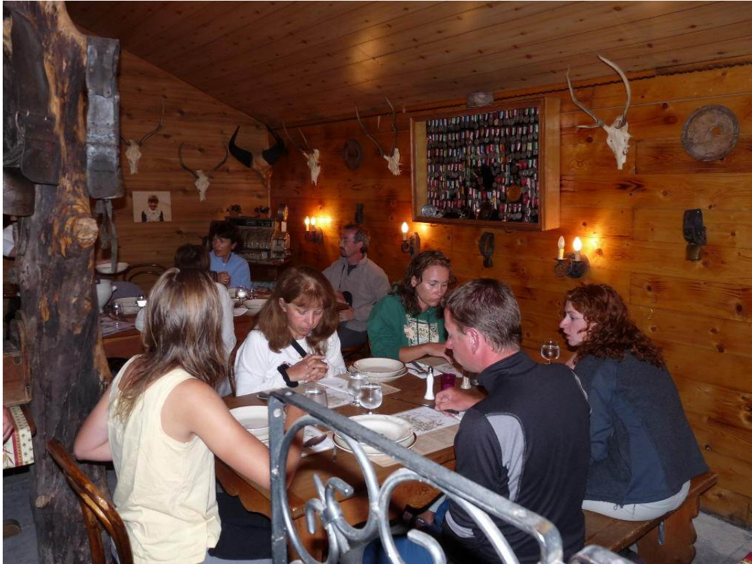
Ah ! la bonne soupe