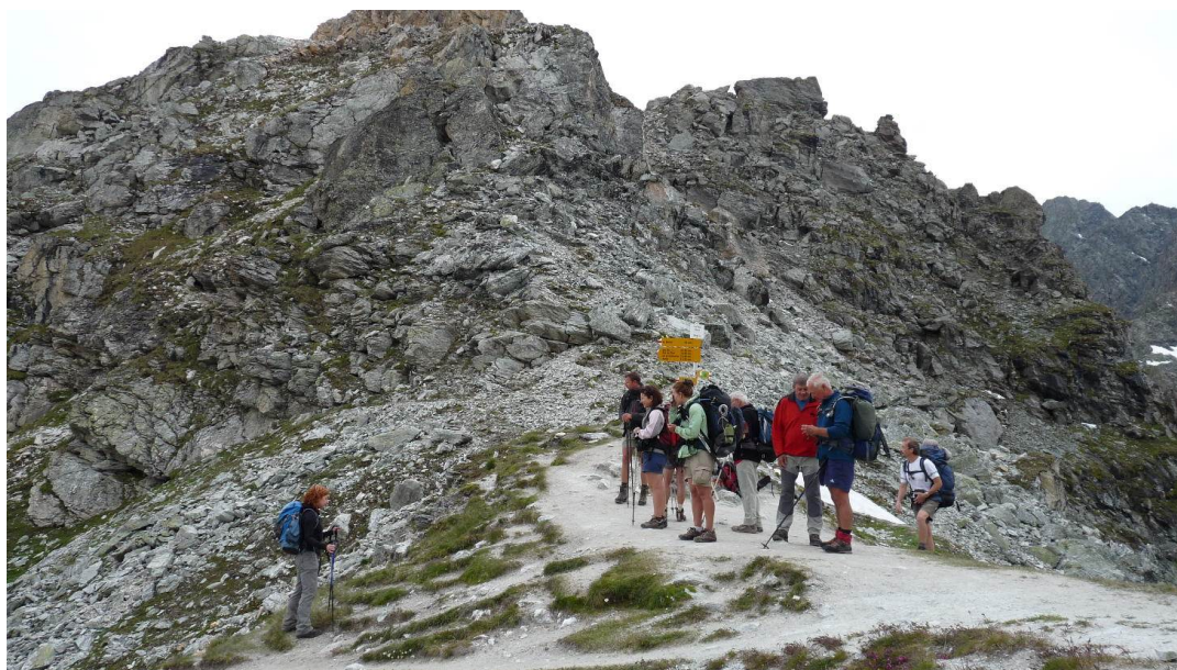
Le col de Prafleuri (2987 m)

Après une nuit agitée en raison du vent et la chaleur dans le dortoir, nous voilà fin prêt pour cette nouvelle étape, départ 7h30, les bagages repartent de leur côté et nous entamons aussitôt l'ascension vers le col