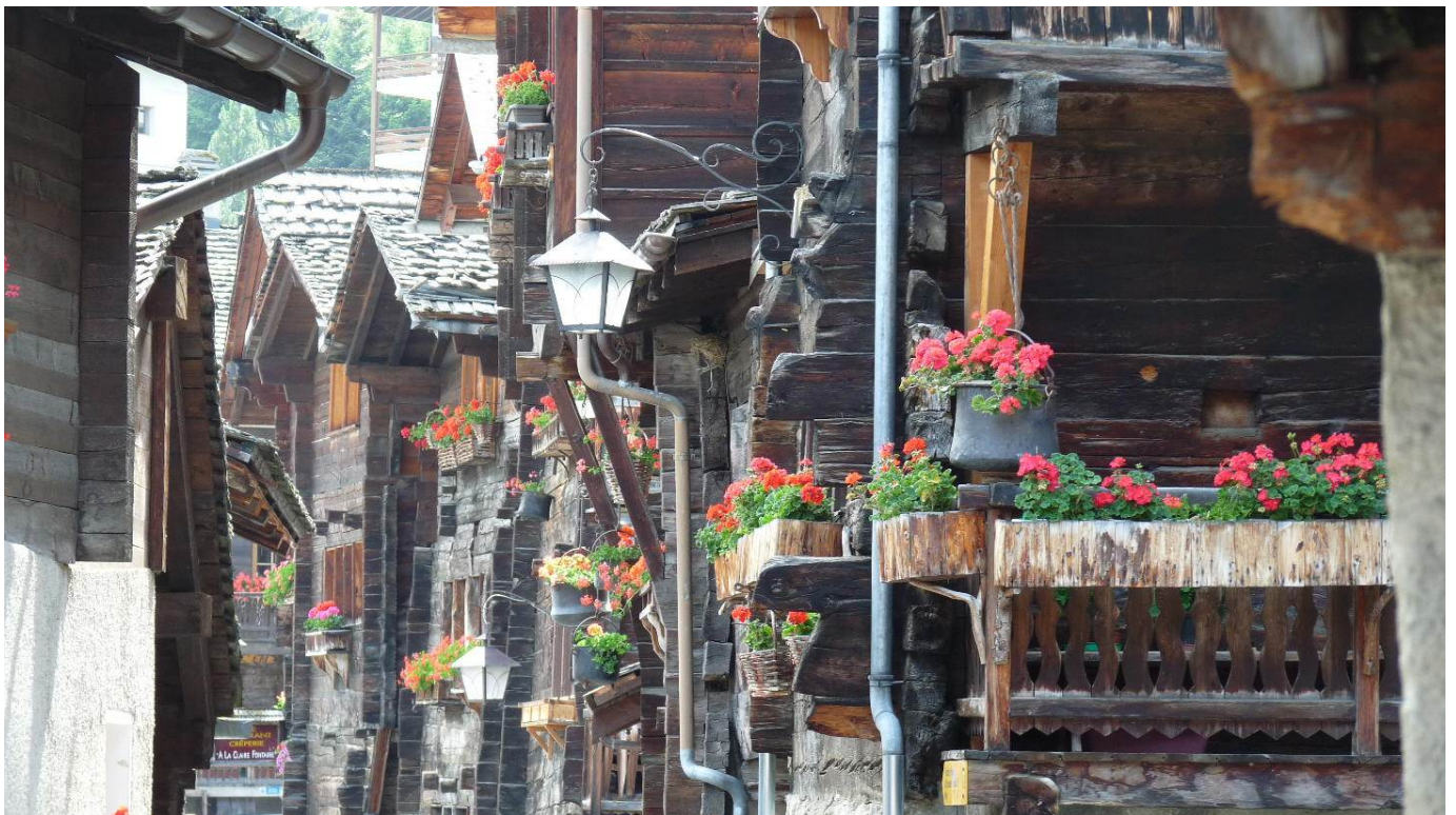
Des fleurs à tous les niveaux