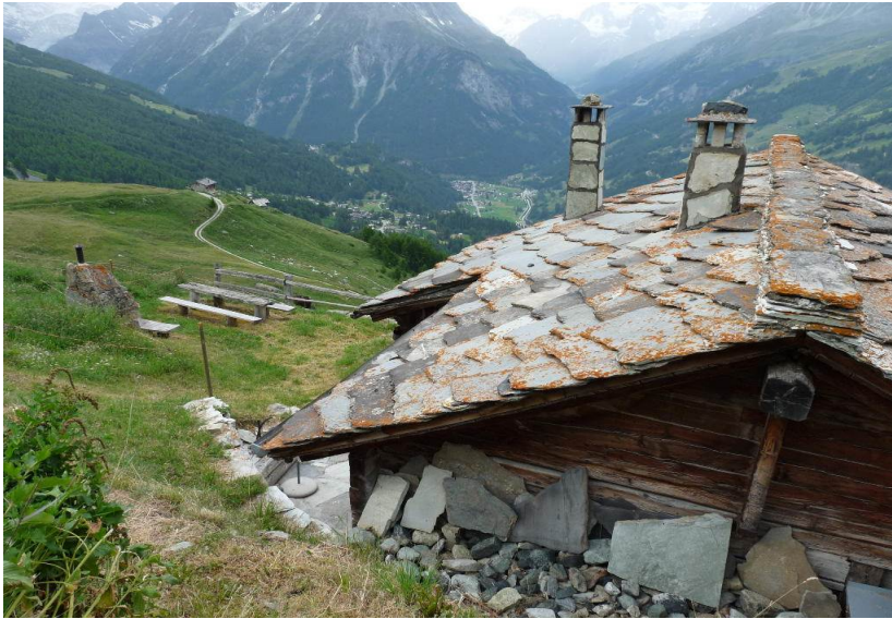
Toits traditionnels en lauses et vue sur la vallée d'Arolla

Transfert par bus au-dessus d'Evolène pour nous conduire à la cote 1700 d'où nous commencerons l'étape, direction le col de Torrent (2916 m) et descente sur le lac de Moiry. Au passage quelques fermes ou maisons de villégiature avec de superbes toits en lauses. Le temps est un peu maussade et la pluie nous accompagnera lors de la descente jusqu'au lac.