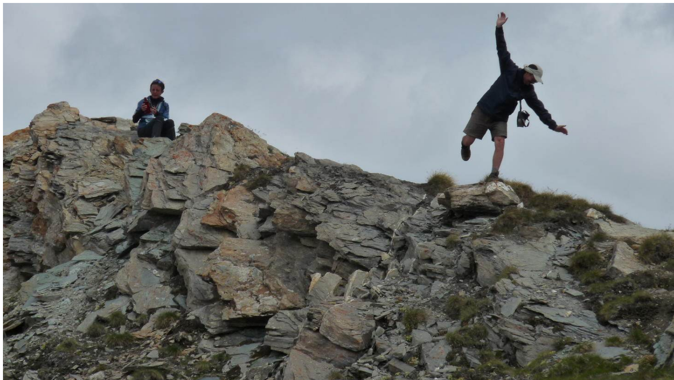
Un nouveau spécimen d'oiseau prenant son envol