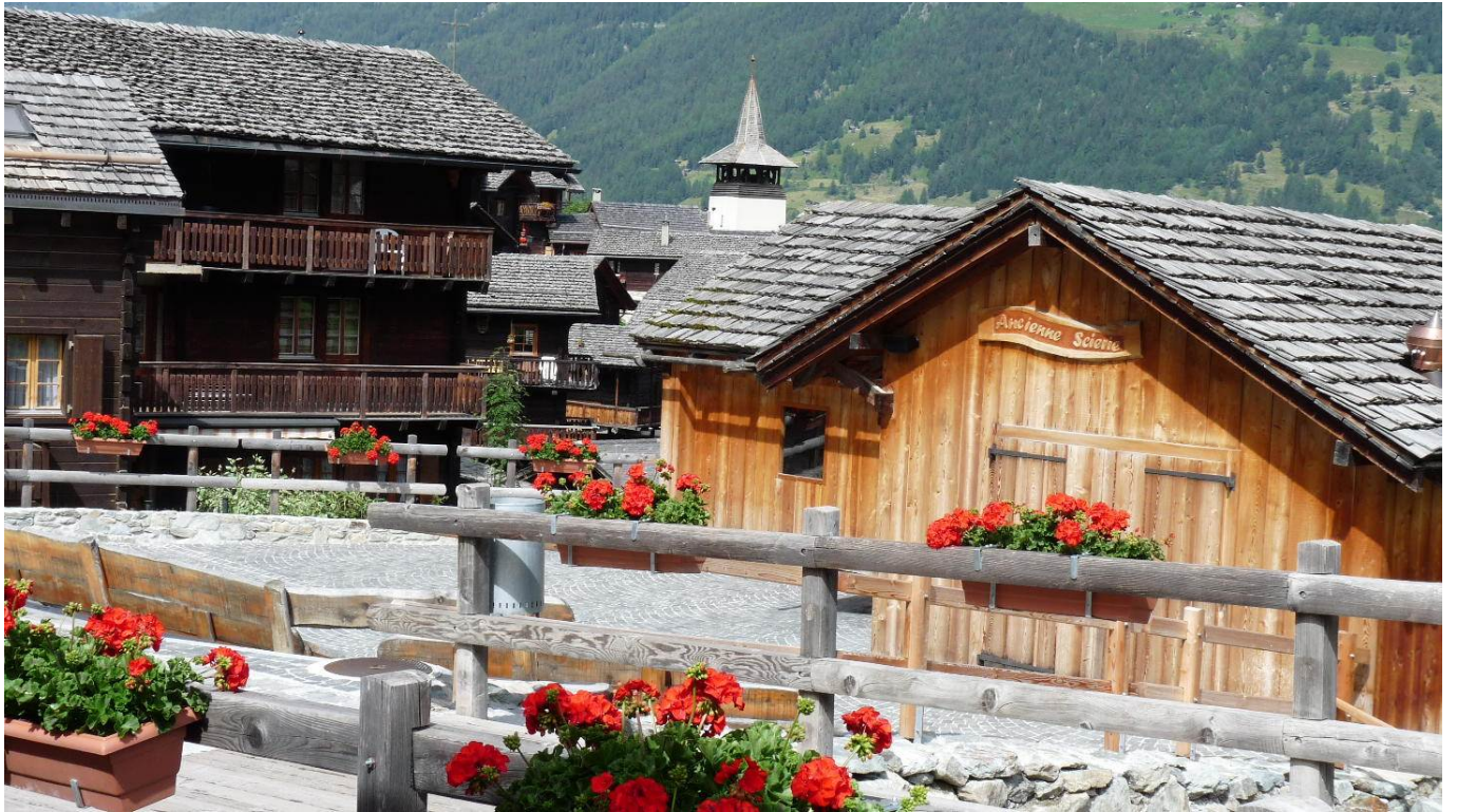
Le village de Grimentz