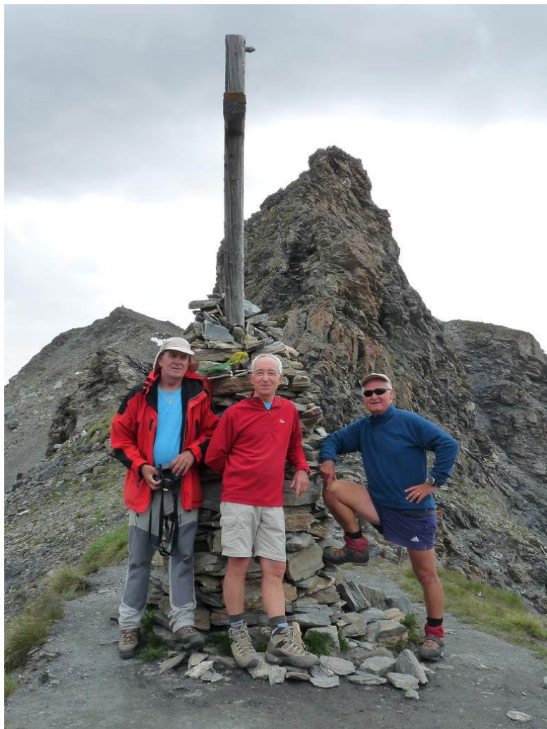
Au col de Torrent (2916 m) et vue sur le lac de Moiry (au loin)