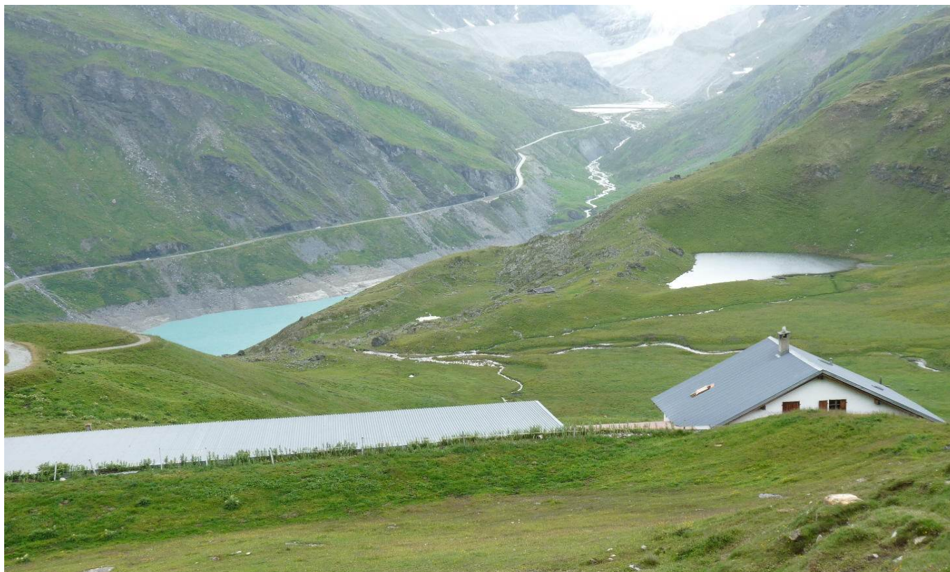
Au fond le glacier de Moiry

La fin de l'étape conduit au village de Grimentz avec ses maisons traditionnelles en bois superbement fleuries.