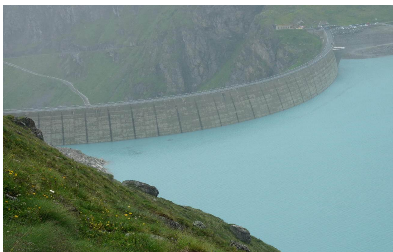
Le barrage de Moiry