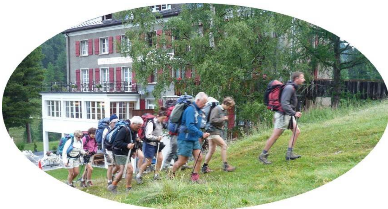
Le départ depuis l'hôtel (en fond d'image)