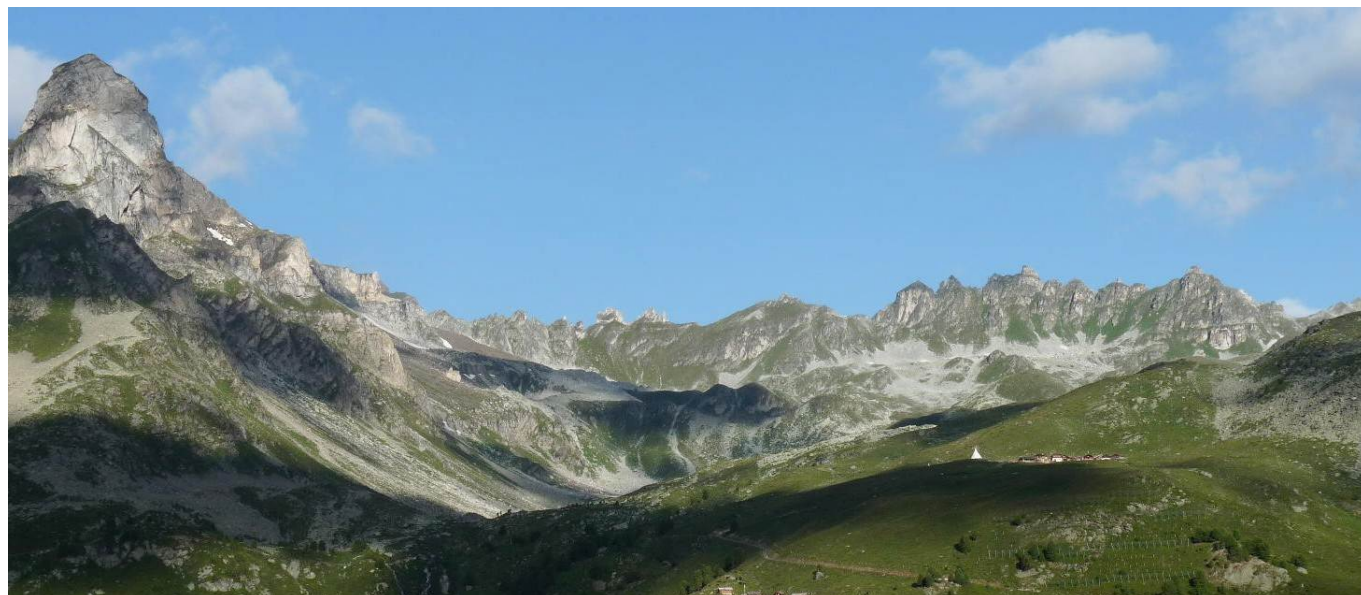
Hier nous étions sur le versant qui nous fait face, le col de Meidpass est au-dessus du tipeg, légèrement sur la gauche