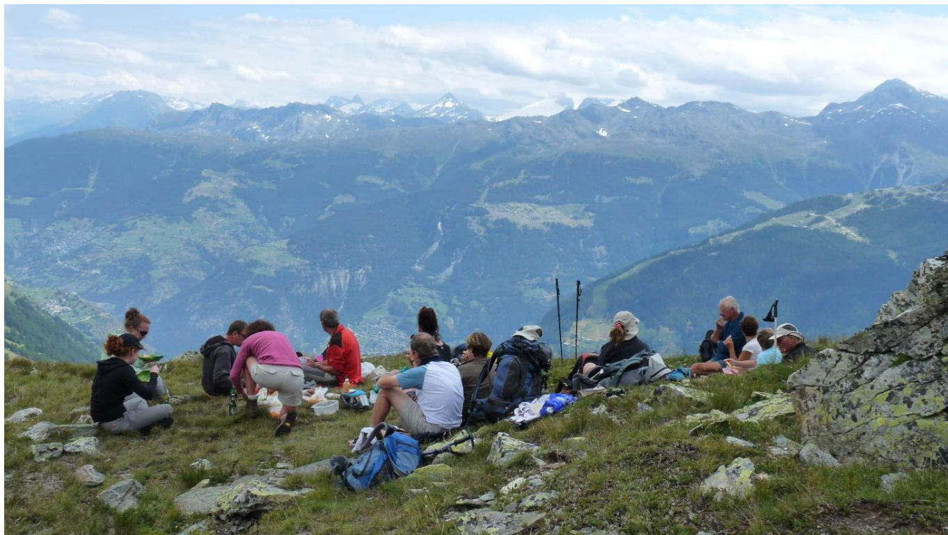
Repas de midi Côté pile, Côté face