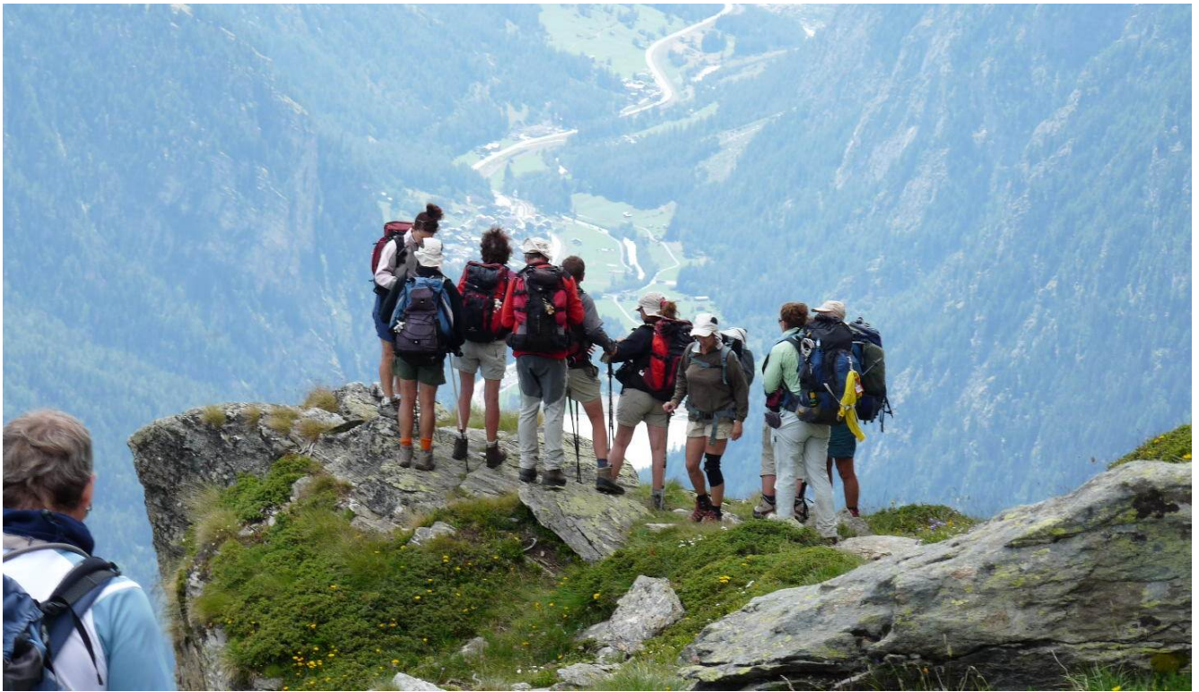
La superbe vue sur la vallée de Matter Horn