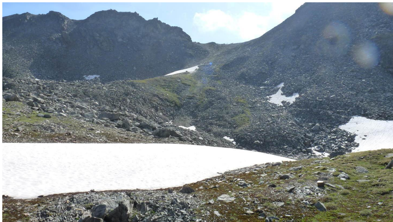
Les névés avant la dernière montée vers l'Augstbordpass (2600 m)

Mathilde et un autre accompagnateur nous attendent à Saint Niklaus avec deux bus pour nous transporter jusqu'à Tash où nous devons changer de véhicules, l'accès à Zermatt n'étant autorisé qu'aux transporteurs locaux. Arrivée à l'hôtel vers 17h30 où nous disposerons de chambres très confortables. Un bel orage viendra rafraîchir la soirée.