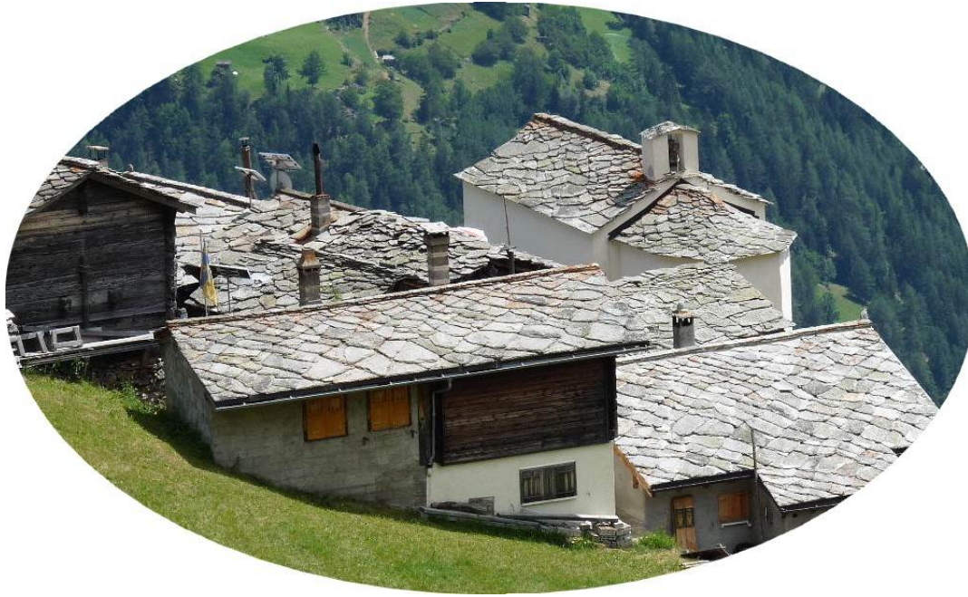
Le village de Jungu sur le trajet de la descente vers Saint Niklaus