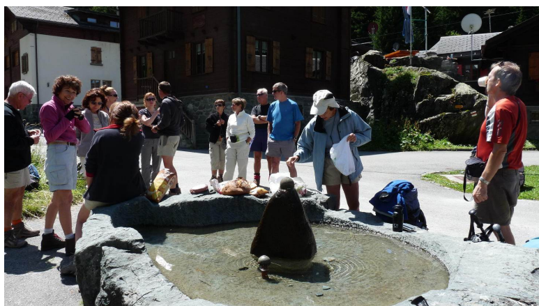
Préparation pour le casse croûte