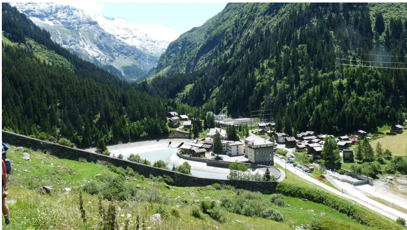
Le village de Fionney