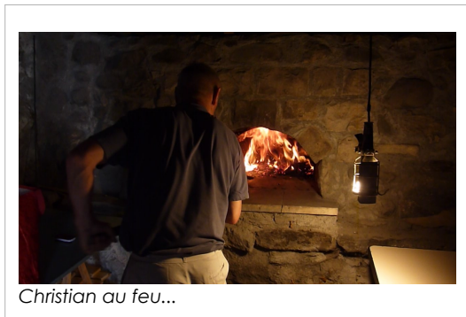
Christian au feu...

C'est donc sous un grand soleil que nous nous sommes retrouvés à 16 personnes au hameau du Fein, au dessus de Chorges. Premier travail, décharger la remorque du bois récupéré depuis plusieurs mois et ranger celui-ci dans le four, à une portée de main de l'ouverture de l'ancre mystérieux fermé pour l'instant d'une porte en bon métal épais.