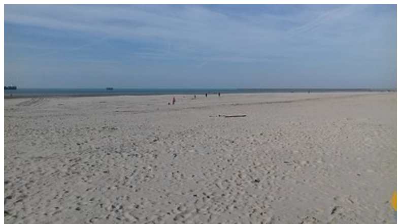
En bordure de la plage de Boulogne sur Mer.