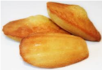
Boite de 50 de 1,250 kg Prix = 11,80 €