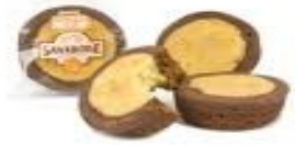
Boite de 68 de 1,870 kg Prix = 16,40 €

Commande le 1er mardi des mois de janvier / mars / mai / juillet / septembre / novembre 2015 (sauf demande insuffisante)