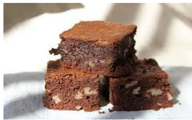
Sachet de 400g Prix = 3,60 €