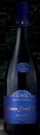
Corton Grand Cru 50 2017 Le Rognet