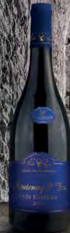
Santenay 1 er Cru 2017 46 Grand Clos Rousseau