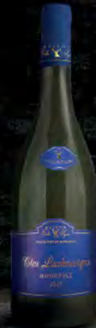
Clos Lachassagne 2015 44 Blanc