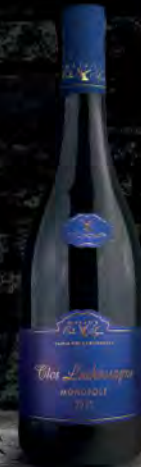
Clos Lachassagne 2015 45 Rouge