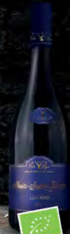
Nuits Saint Georges 49 1 er Cru 2017 Les Crots Bio