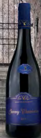
Gevrey-Chambertin 47 2016