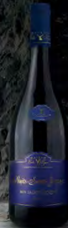
Nuits Saint Georges 48 2017 Aux Saint-Jacques