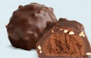
Praliné aux noisettes et éclats d'amandes, chocolat noir 60% de cacao