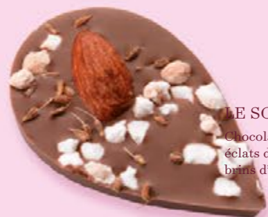
LE SONGE DE JULIETTE Chocolat au lait 35% de cacao, amande, éclats de nougat, brins d'anis