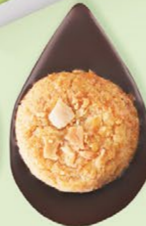
BISCUIT AMANDES Chocolat noir 60% de cacao