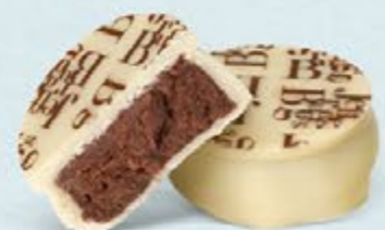
Puissante ganache de chocolat noir au cacao de Sao Tomé, chocolat blanc