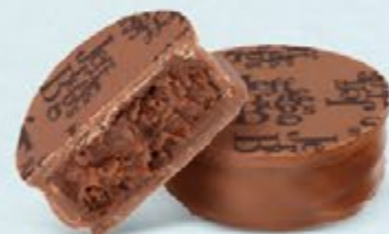
Ganache de chocolat noir au cacao fruité de Saint Domingue, chocolat au lait 36% de cacao