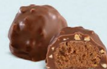
Praliné aux noisettes et éclats d'amandes, chocolat au lait 36% de cacao