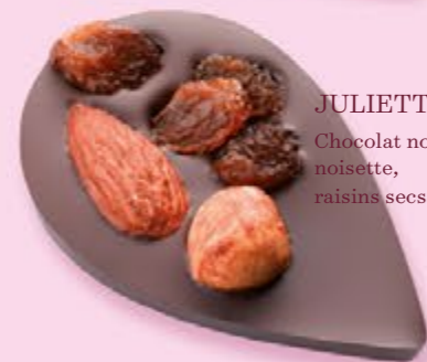
JULIETTE IN THE CITY Chocolat noir 70% de cacao, amande, noisette, raisins secs