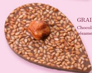
GRAINE DE JULIETTE Chocolat au lait 35% de cacao, sésame, noisette caramélisée