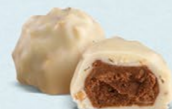
Praliné aux amandes et éclats d'amandes, chocolat blanc