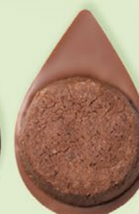
BISCUIT BROWNIE Chocolat au lait 35% de cacao

Les prix barrés sont les prix de vente TTC maximum en boutique. *Prix de vente TTC maximum.