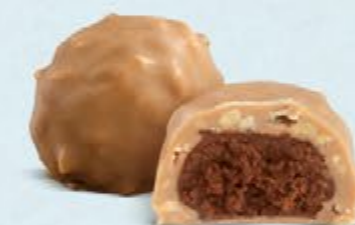
Praliné aux noisettes et éclats d'amandes, chocolat blanc caramélisé