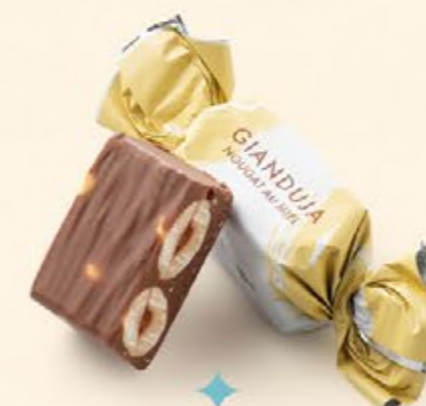
Nougat au miel