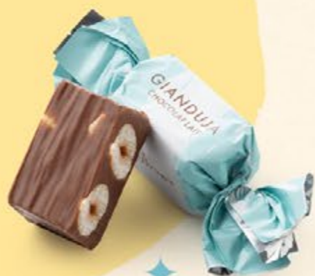
Chocolat au lait

L'alliance exquise du croquant et du fondant.