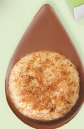
BISCUIT NOISETTES Chocolat au lait 35% de cacao