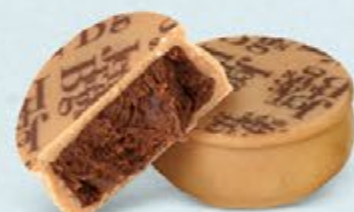
Ganache aromatique de chocolat noir au cacao d'Équateur, chocolat blanc caramélisé