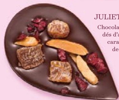
JULIETTE & TOM Chocolat noir 60% de cacao, dés d'abricots secs, amandes caramélisées et morceaux de cerise