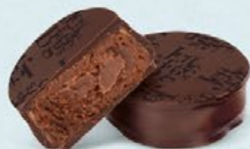
Ganache corsée de chocolat noir au cacao du Venezuela, chocolat noir 70% de cacao

Venezuela, Saint Domingue, Équateur, Sao Tomé... offrez-vous un tour du monde de saveurs intenses grâce à ces recettes de ganaches élaborées à partir de cacaos d'origines.