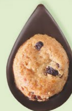
BISCUIT CRANBERRIES Chocolat noir 60% de cacao