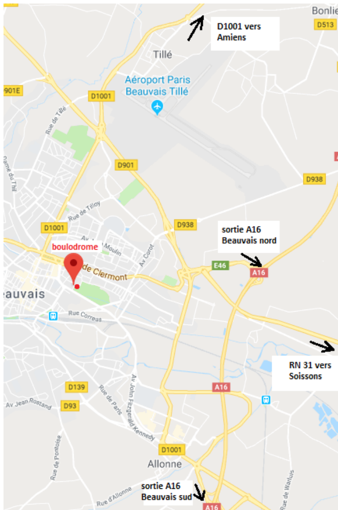
Plan de la ville

Boulodrome municipal couvert du Parc Kennedy Rue Suzanne Lenglen, Beauvais