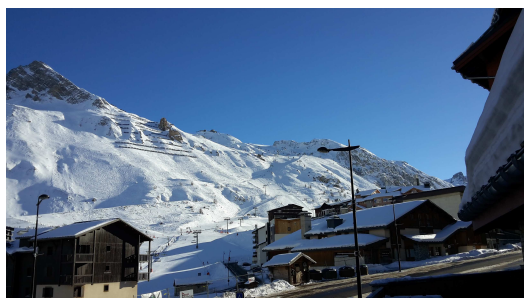
Vue depuis la terrasse de l'hôtel