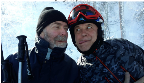
Les méfaits de l'altitude ou du vin chaud !!!!

Les non skieurs eux, ont comme d'habitude découvert la région (raquette, balade et autres). Et puis, il y eu tellement de choses à voir à faire qu'il nous faudrait 50 pages pour tout vous dire*. La meilleure solution pour tout savoir, c'est de nous rejoindre l'an prochain.