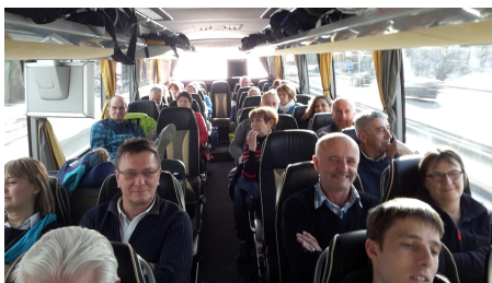
Le voyage super confort