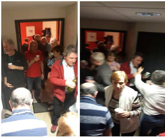
Les chambres sont petites mais le couloir assez large ouf!!!

Comme on ne change pas une organisation gagnante, nous avons cette année tous préparé un casse croute "sud-ouest" dans la salle hors-sac de Tignes, et l'apéro traditionnel de 19h à 20h, le tout dans une bonne ambiance