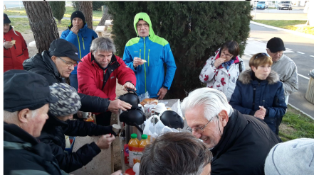
Le petit déj...

Cette année l'ASCE31 a proposé un séjour dans les Alpes à Tignes-Val d'Isère, plus exactement Tignes le Lac.