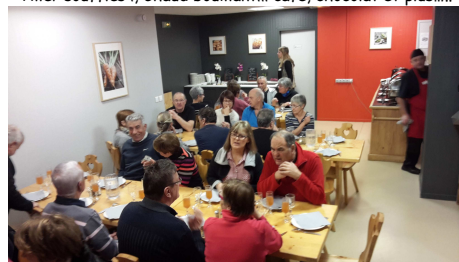
La salle à manger