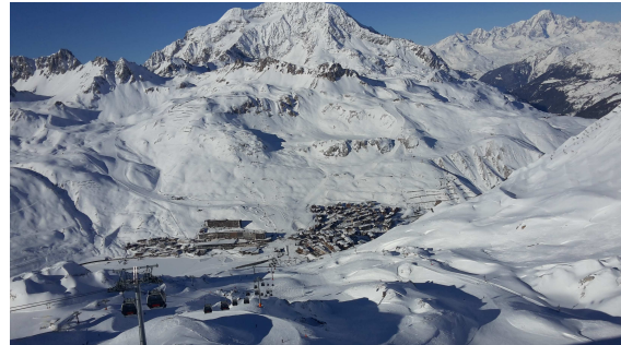
Tignes le Lac

L'embarquement a eu lieu au siège de la DIRSO le dimanche matin vers 6h30, après deux escales pour le petit-déjeuner vers Béziers et Grenoble pour le déjeuner, nous sommes bien arrivés vers 17h dans les temps (car le lac était gelé !!!!!)