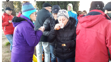
Aller souffles !, Chaud bouillant!!! café, chocolat et plus.....

L'embarquement a eu lieu au siège de la DIRSO le dimanche matin vers 6h30, après deux escales pour le petit-déjeuner vers Béziers et Grenoble pour le déjeuner, nous sommes bien arrivés vers 17h dans les temps (car le lac était gelé !!!!!)