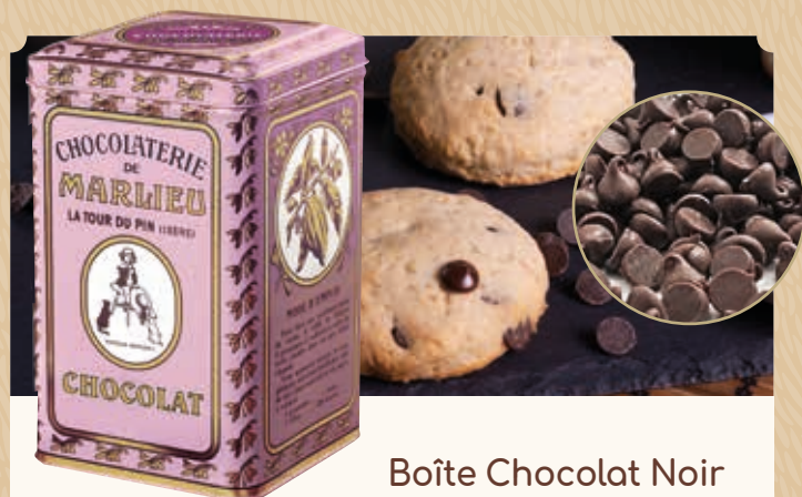
Boîte Chocolat Noir en pépites

C67 Recharge* de chocolat en poudre. 1 kg 17,70€ 26,20€