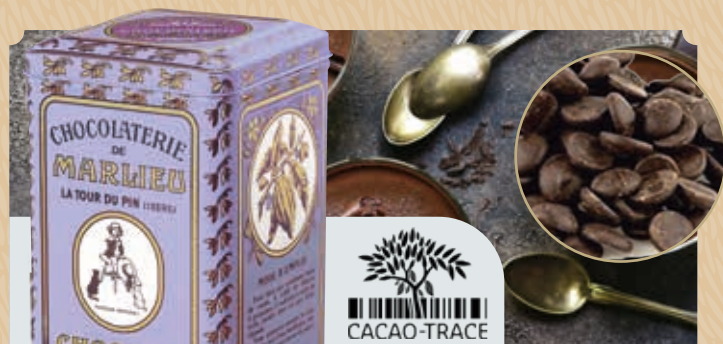
Boîte Chocolat à fondre 60% en galets

C72 Chocolat à fondre Noir 60% en boîte métal. 750 g 20,95€ 31,05€