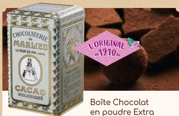
Boîte Chocolat en poudre Extra

C73 Recharge* de chocolat à fondre Noir 60%. 750 g 17,70€ 26,20€