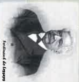
Ferdinand de Lesseps