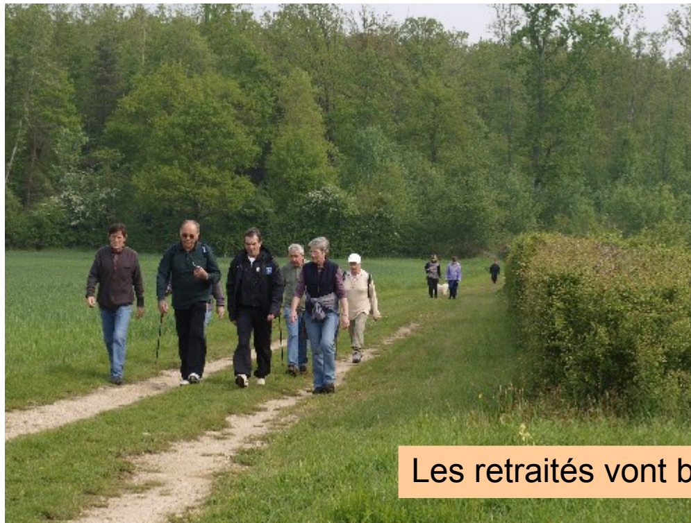
Les retraités vont bien