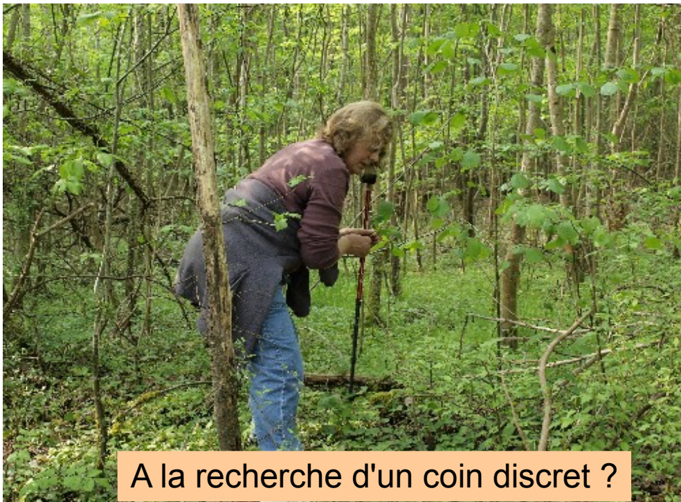
A la recherche d'un coin discret ?