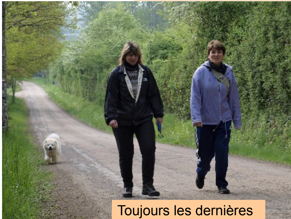
Toujours les dernières