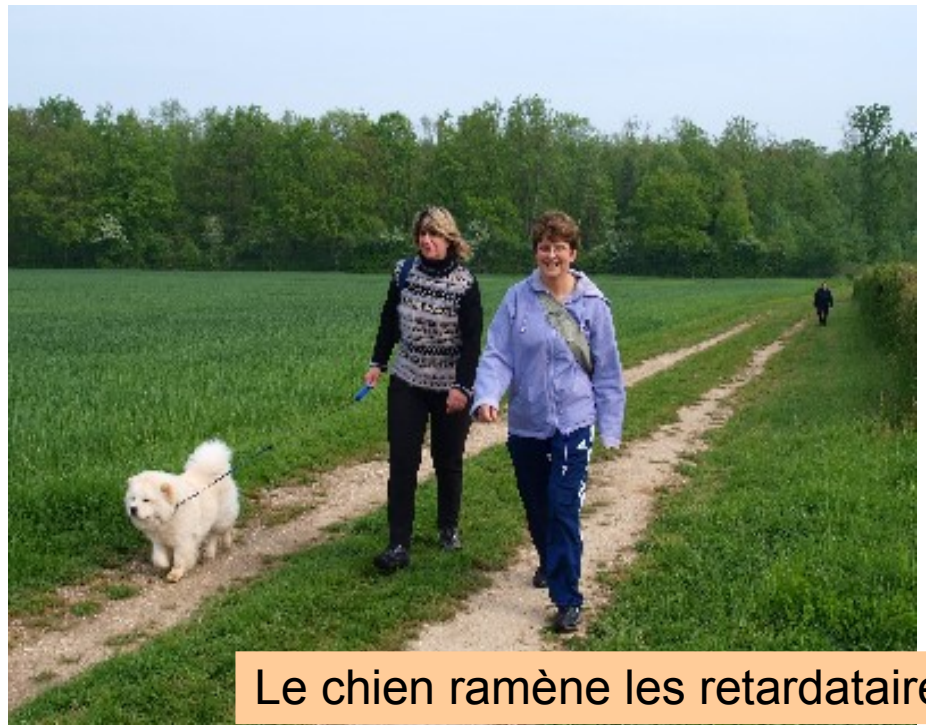
Le chien ramène les retardataires