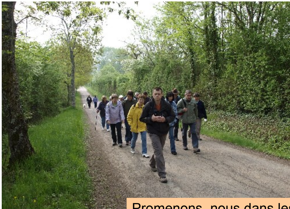
Promenons nous dans les bois... (air connu)