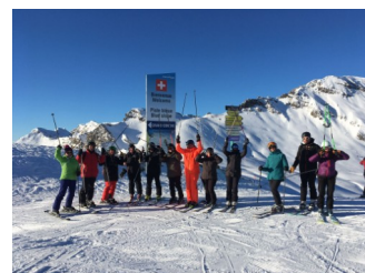
Une partie de la fine-équipe