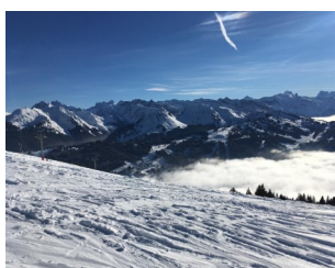
Soleil en haut nuages en bas !!!