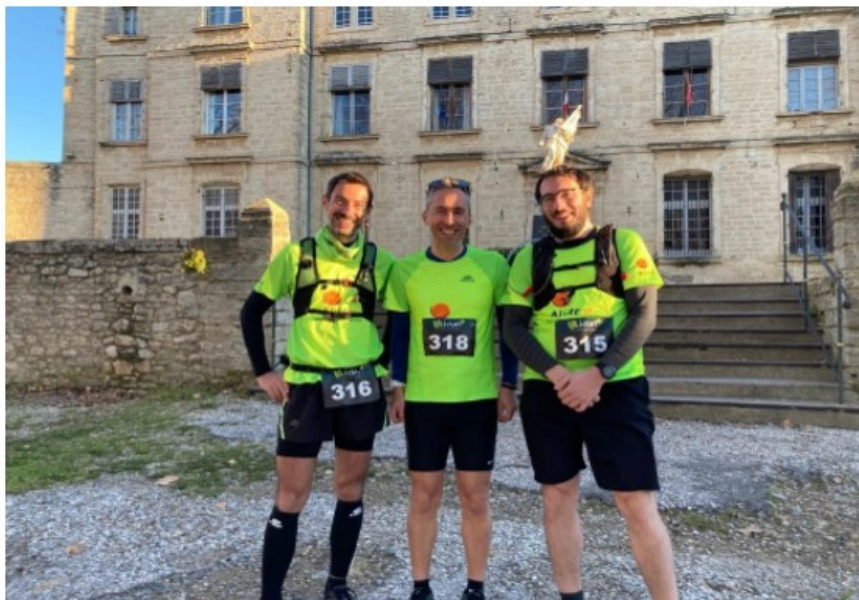
Challenge national de trail à Pignan

- Participation à l'organisation d'un relais pour la journée ASCE 31 organisée 1 er octobre. La section a assuré le tracé du circuit, le balisage et la logistique permettant la tenue de ce relais même si la participation n'a pas été au rendez-vous et à la hauteur de notre investissement.