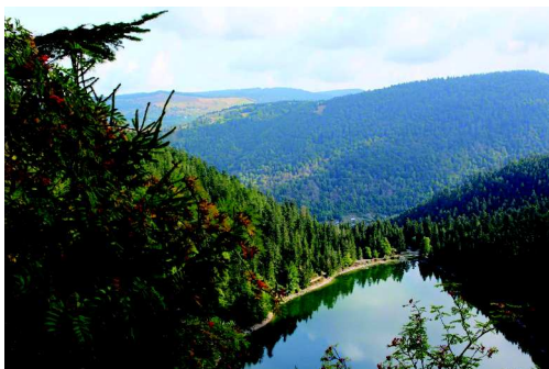
Lac des Corbeaux