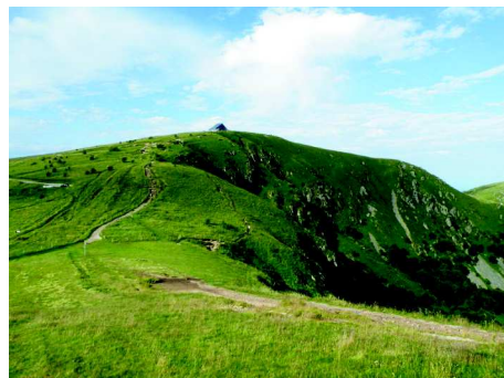
Sommet du Hohneck