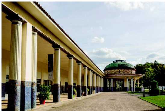
Les thermes de Contrexéville