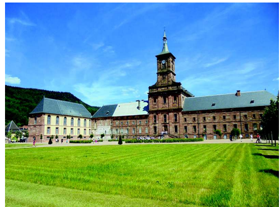
Abbaye de Moyenmoutier