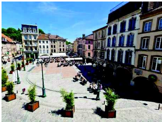
Epinal - place des Vosges

Département de culture et de nature, les Vosges recèlent un patrimoine connu, parmi lequel on peut citer quelques éléments emblématiques : l'imagerie d'Epinal, la maison natale de Jeanne d'Arc à Domrémy-la-Pucelle, le théâtre du peuple de Bussang... C'est aussi le département de naissance et de scolarité de Nicolas MATHIEU, prix Goncourt 2018.