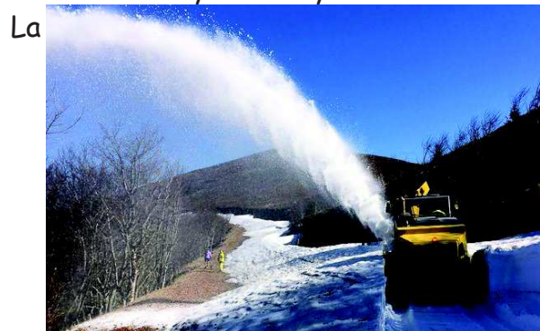
route des crêtes