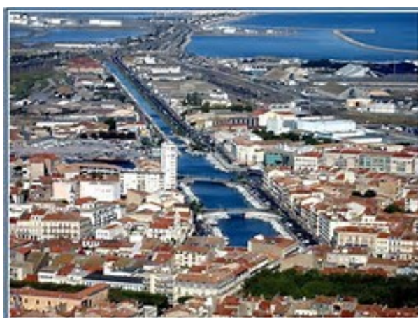
Le canal Royal « colonne vertébrale » de la ville

Ce sport, pratiqué depuis l'inauguration du port en 1666 indissociable de l'histoire de la ville, reflète l'âme de ses habitants et reste au delà du folklore, le symbole d'une forte identité culturelle .... singulièrement attachante !