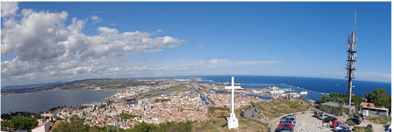
L'Étang de Thau