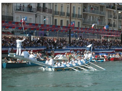
Tournois de joutes