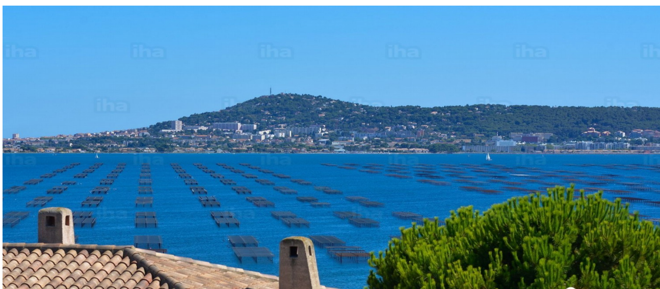
Vue sur Sète depuis Bouzigues et ses parcs à coquillages (moules et huîtres) de l'étang de Thau