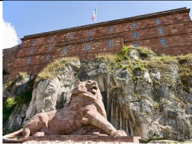
Territoire de Belfort (90)