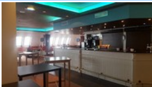
Restaurant (3 dans l'hôtel)