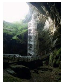
Gouffre de Padirac