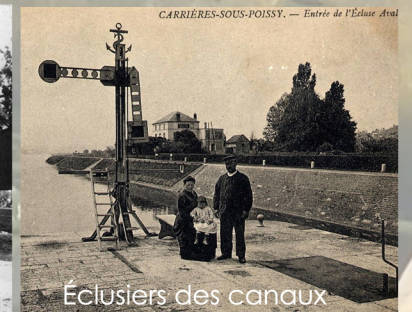
Éclusiers des canaux