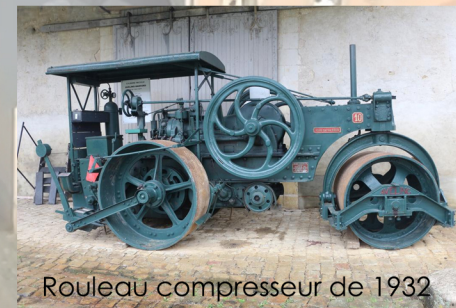
Rouleau compresseur de 1932