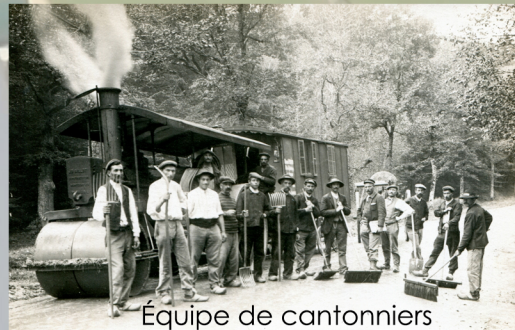
Équipe de cantonniers