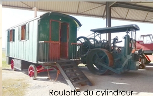
Roulotte du cylindreur