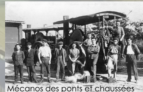
Mécanos des ponts et chaussées