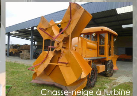
Chasse-neige à turbine