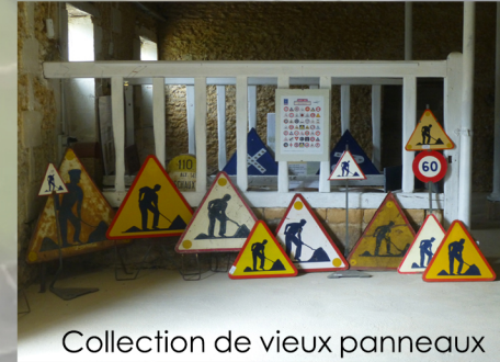
Collection de vieux panneaux