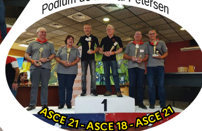
ASCE 21 - ASCE 18 - ASCE 21