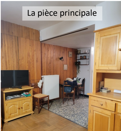
La pièce principale