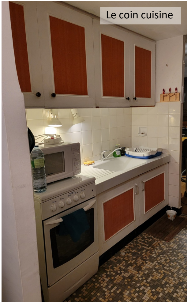
Le coin cuisine