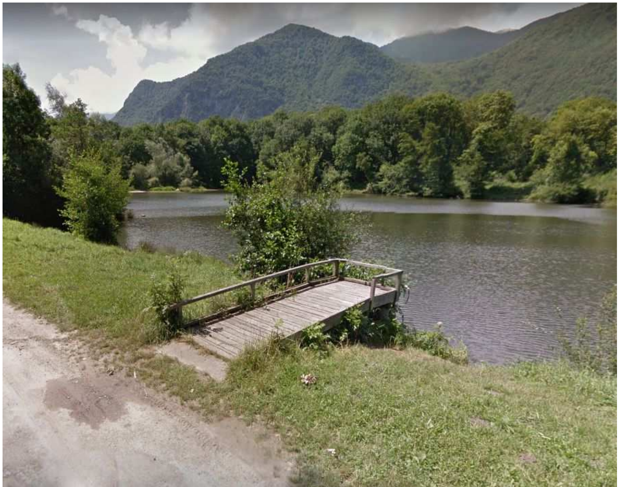
Figure 1 Lac de Cierp, 1 catégorie piscicole, salmonidés dominants