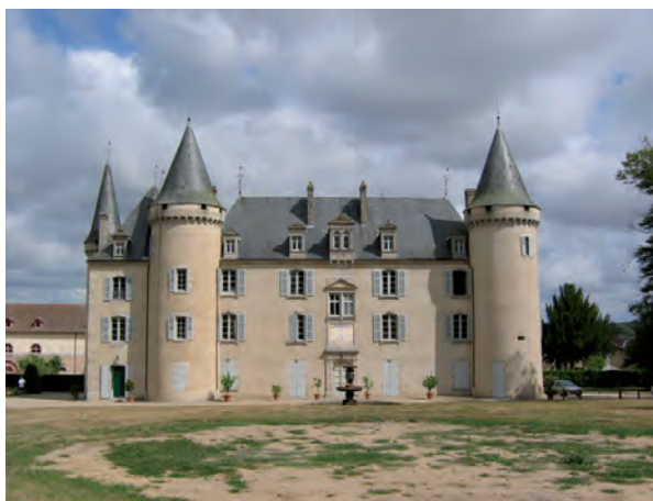
Château de Nexon

8 Variante : au point 8 possibilité d'allonger votre parcours en prenant le chemin à gauche qui devient goudronné. Arrivé à la route, au lieu-dit "La croix Sainte-Valérie", l'emprunter à droite. Rejoindre le chemin en bordure de l'étang à droite, puis à gauche, pour rejoindre le point de départ.