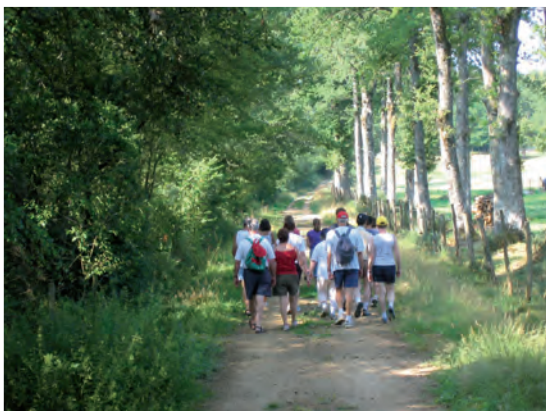
Chemin de la commune de Nexon

7 Prendre le chemin à droite qui redescend et rejoint les rives de l'étang de la lande que vous longez. Arrivé à la base de loisirs, rejoindre le parking.