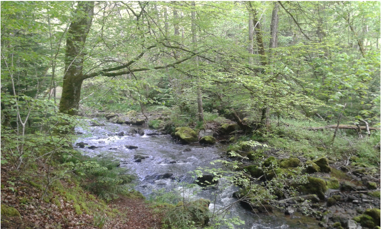
Le ruisseau semble tout d'abord tranquille...

Les marcheurs se sont retrouvés au pied de l'église de Besse, accompagnés du beau temps, pour une randonnée prévue sur 10 kilomètres. Une distance plus courte que d'habitude, mais avec un détour prévu pour admirer les cascades de la Couze Pavin.