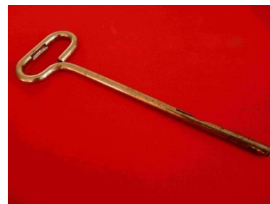
14 - Ouvre-boîte