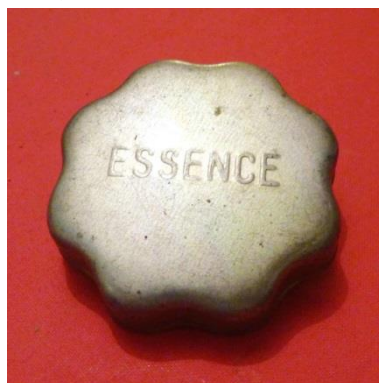
12 - Bouchon de réservoir d'essence (pour vieille voiture)