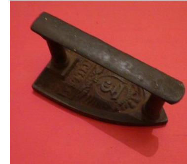
4 - Fer à repasser