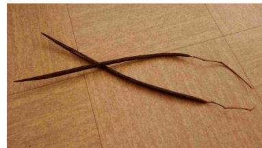
7 - Cosses de catalpa (contiennent les graines)