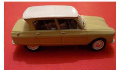
9 - Citroën AMI 6