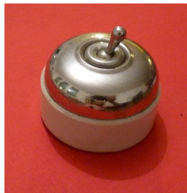
13 - Interrupteur électrique d'appartement