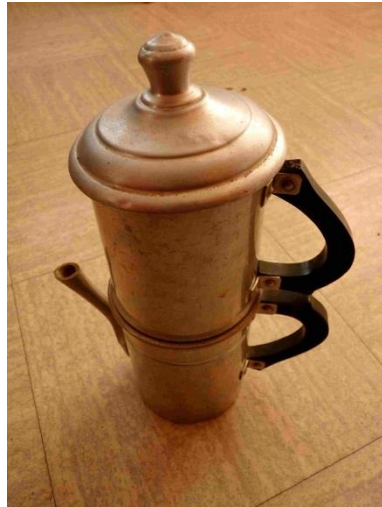
1 - Cafetière