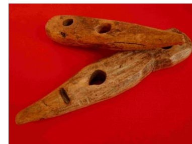
15 - Tacoure (ou tacoule)