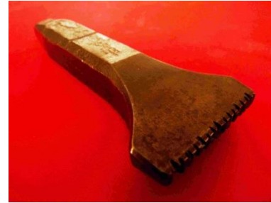
3 - Fer gravé à marquer les outils (ici « MARCHAND », nom de l'ébéniste)