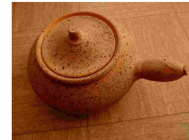
10 - Diable charentais