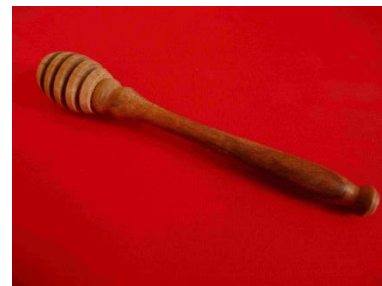
8 - Cuillère à miel