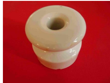
2 - Isolateur électrique