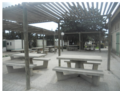
Le coin convivialité du camping

Voilà plusieurs années que nous vous parlons de l'achat d'une unité d'accueil en bord de mer. C'est un investissement important que nous ne voulions pas bâcler en achetant n'importe quoi.