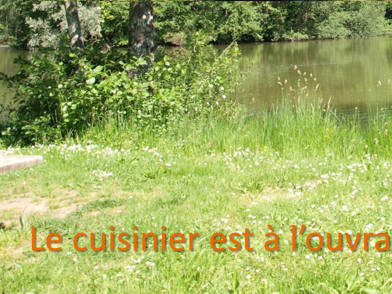
Le cuisinier est à l'ouvrage