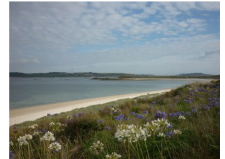
Les îles Scilly