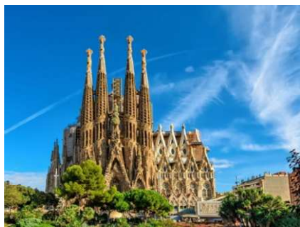
La Sagrada Familia