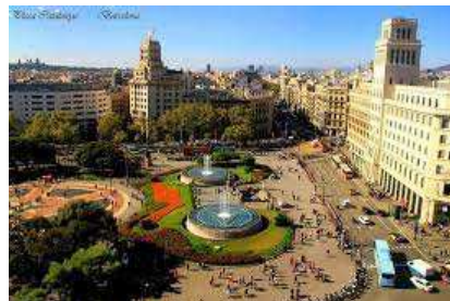
Place de Catalogne